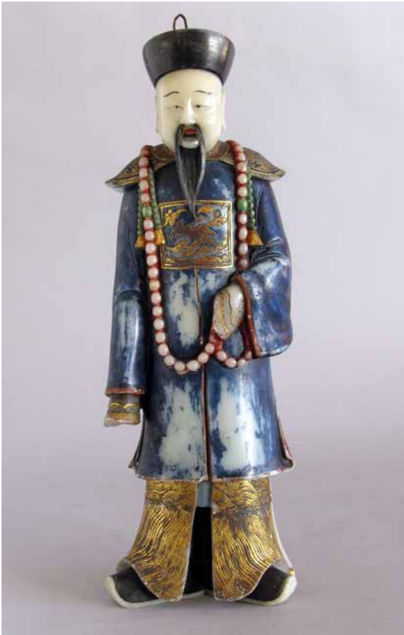
Figura 3. Escultura de esteatita pintada, representando a un oficial de la Corte. Dinastía Qing. MNAD (DE10189).