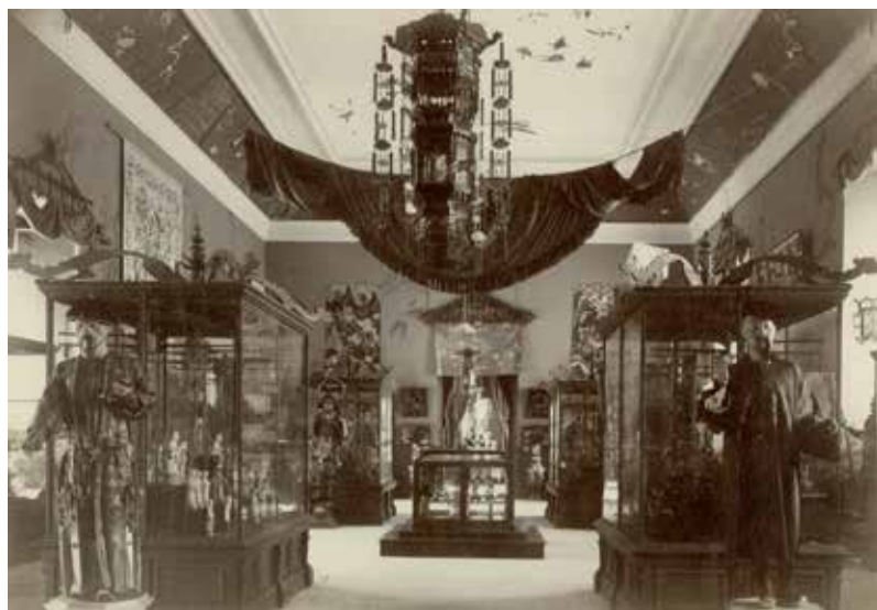
Figura 1. Fotografía de la Sala de China y Japón Antiguos. EHNE de Madrid, 1893.