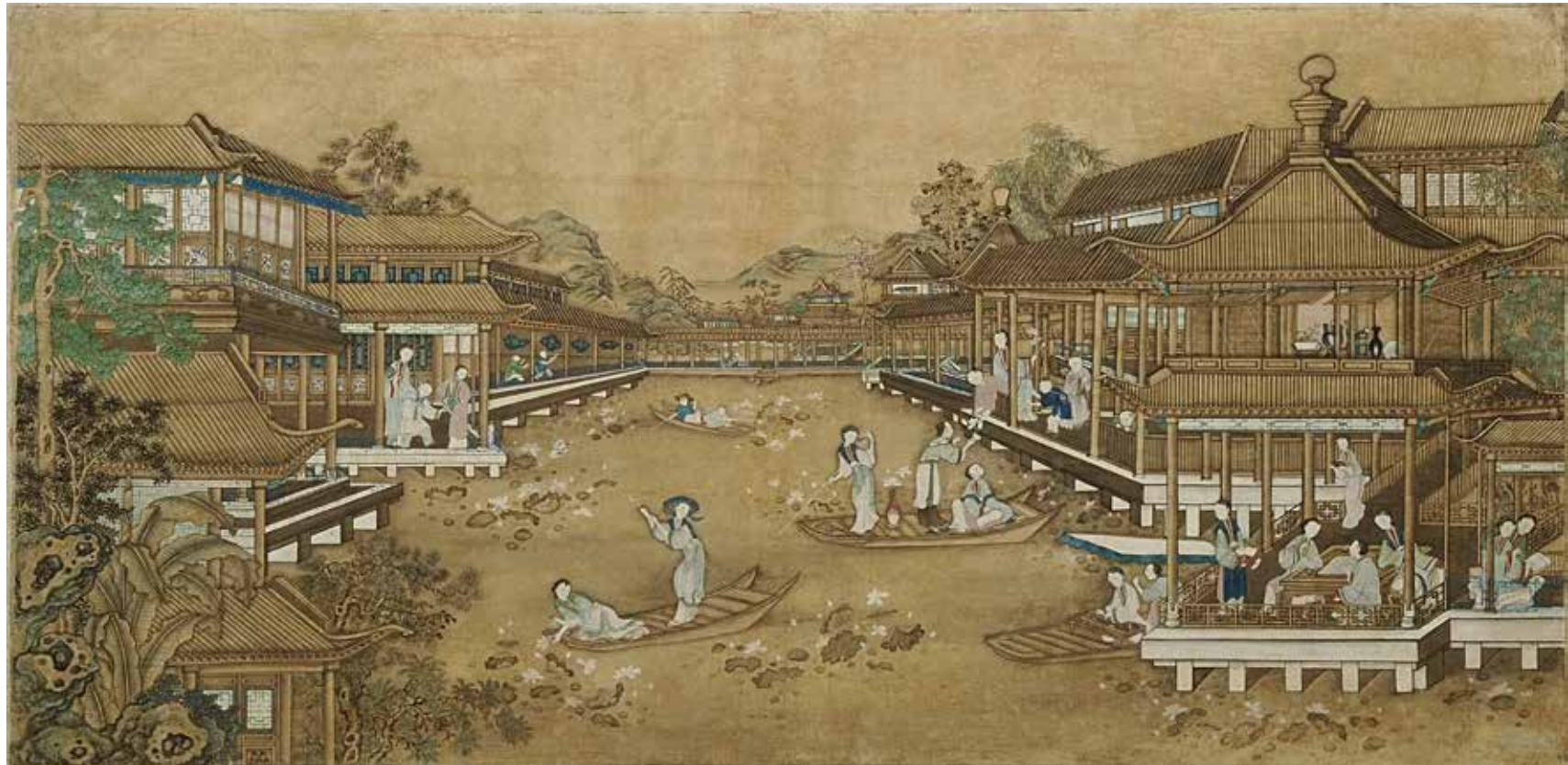
Figura 5. Aguada china, siglo XVIII. MNAD (DE10021).

También podemos señalar que algunos de los vestidos de Corte chinos, como el pu-fú azul (DE16380) o el cinturón que lleva uno de los maniqués (CE16643), proceden del Real Gabinete de Historia Natural y son de los pocos ejemplos del siglo XVIII que se conservan. En el primer inventario del Museo Arqueológico Nacional (1872), se describen como parte del envío del gobernador