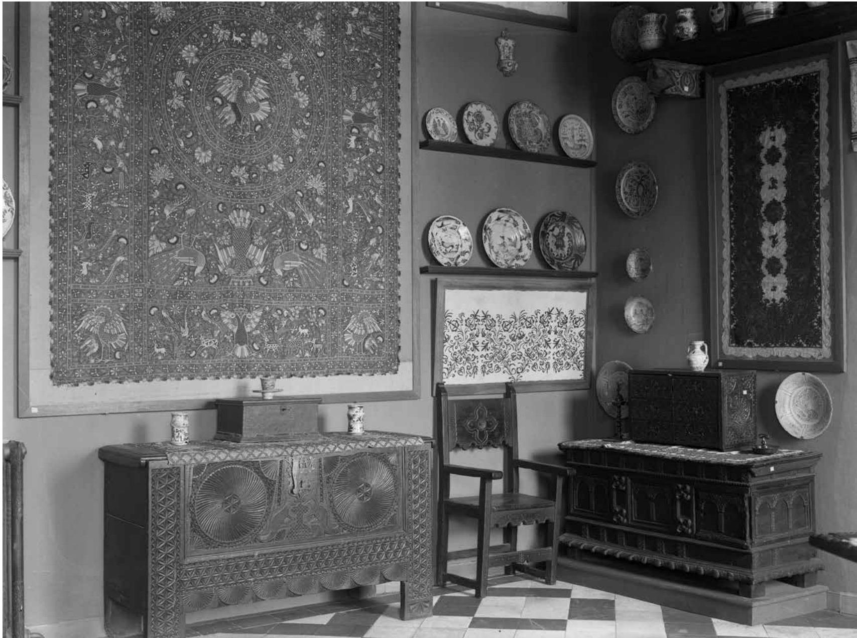
Figura 6. Fotografía de las salas del MNAI hacia 1916, con la colcha luso-india. MNAD (FD11018).