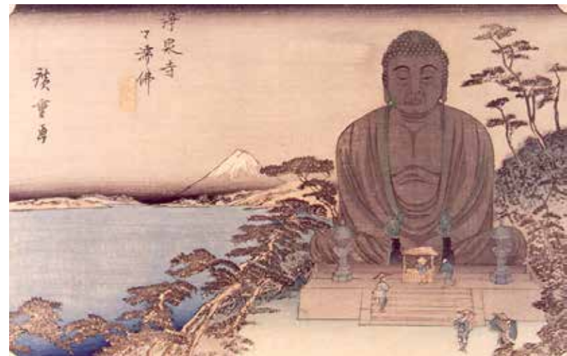
Figura 7. El gran Buda de Kamakura en Josen-ji, templo de la secta budista Zen. Autor: Ando Hiroshige, h. 1835. Estampa. MNAD (CE10831).

La importancia de la colección oriental 10 y su relación con las manufacturas europeas (de las que el MNAD también tiene importantes ejemplos) y españolas, conforma un contexto más complejo que la mera delectación de las piezas «decorativas» y «exóticas» como fue la EHNE de 1893. La posibilidad de poder explicar dichas relaciones ya se hizo en el 2009, con la exposición «Fascinados por Oriente». El éxito de la misma nos habla del interés que existe por estas colecciones y de conocer más sobre las relaciones entre Oriente y Occidente.