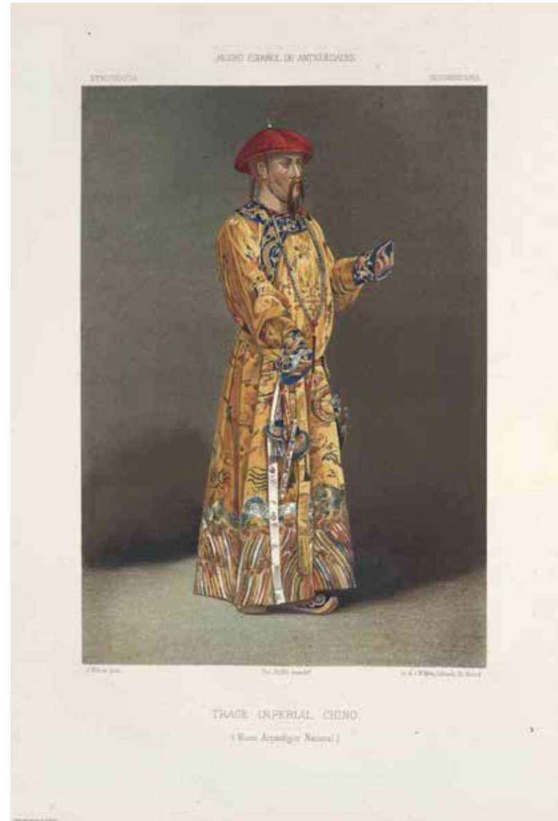
Figura 4. Ilustración del artículo sobre vestidos civiles y militares chinos publicado en el Museo Español de Antigüedades en 1872. Únicamente se puede identificar con seguridad el cinturón que lleva uno de los maniqués de la Sala de China y Japón Antiguos.