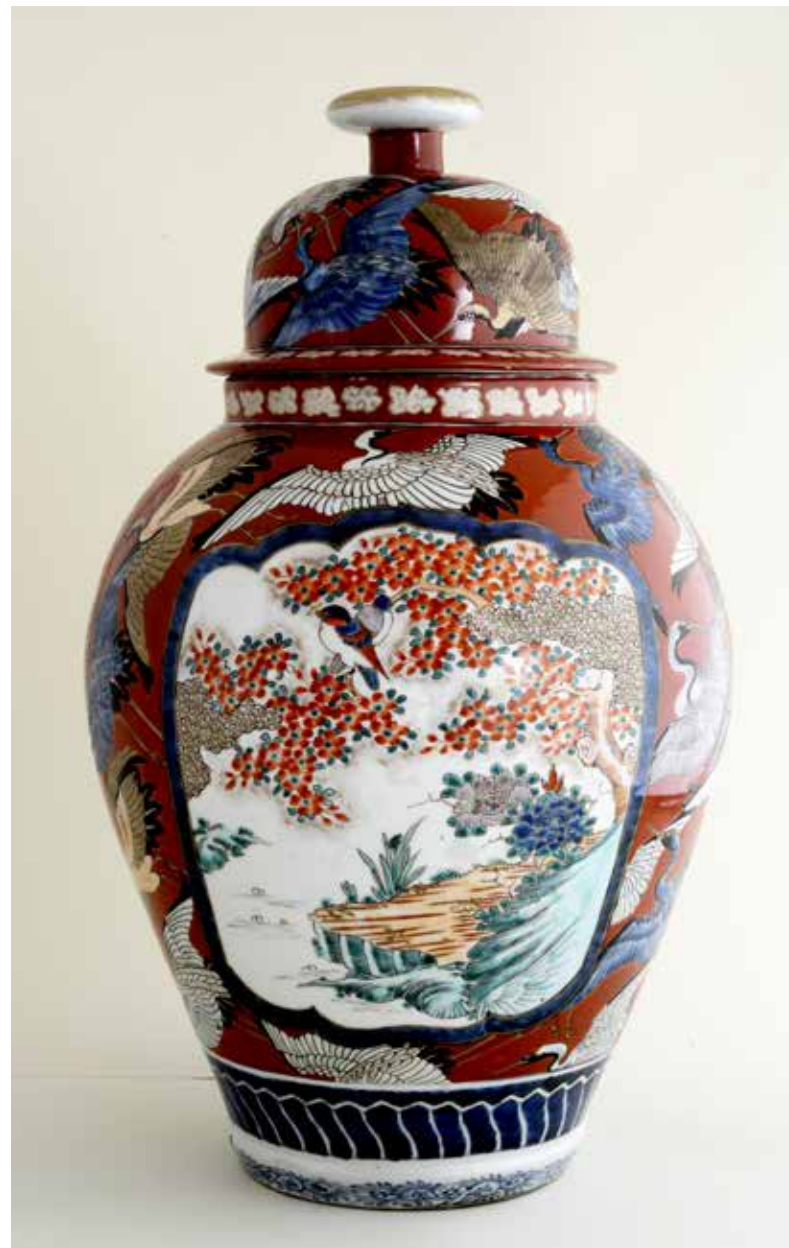
Figura 2. Tibor de porcelana, Corea o Japón, mediados del siglo XIX. MNAD (DE10626).