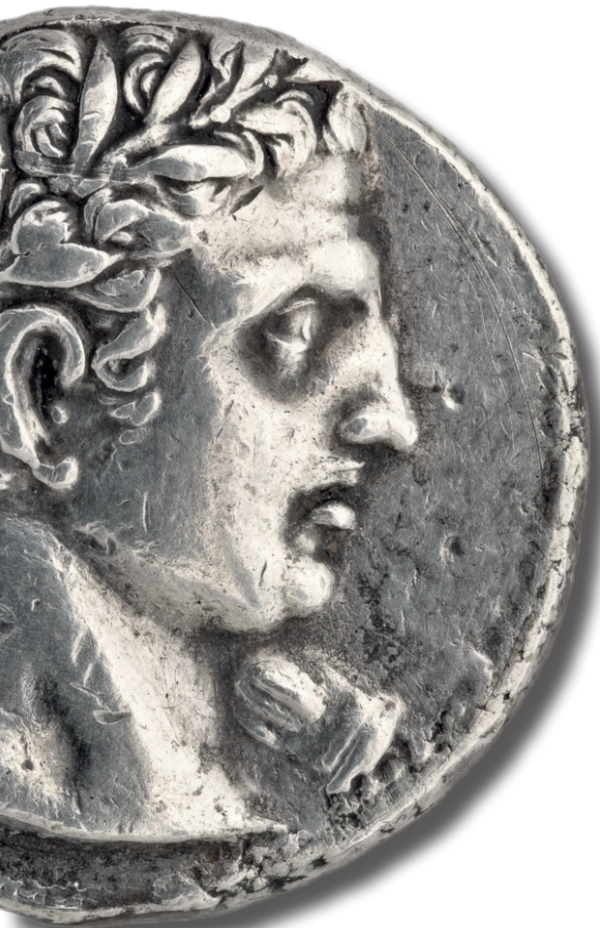
Trishekel hispano-cartaginés de plata, hacia 237-227 a.C. (MAN, 1993/67/1551)