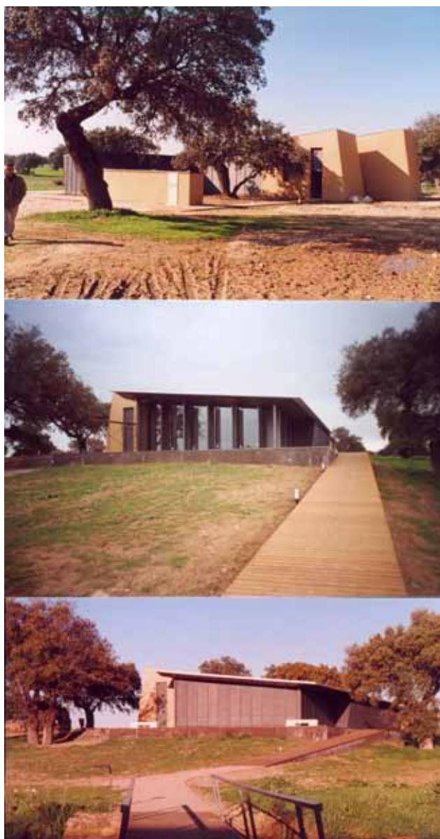
Fig. 1. Vistas exteriores del Centro de Interpretación de Cancho Roano.

Frente al yacimiento, al otro lado del arroyo, se construyó el edificio que alberga el Centro de Interpretación, diseñado por el arquitecto don Tiburcio Martín. El montaje museístico se concibió como una introducción al yacimiento que permita al visitante saber qué va a