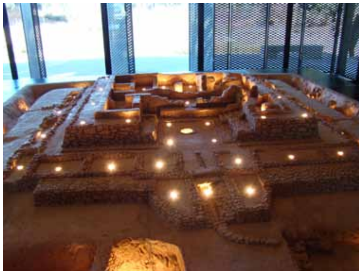
Fig. 3. Maqueta interactiva.

Panel 5 (maqueta): Una gran maqueta del edificio, explica el conjunto y las diferentes zonas del edificio de Cancho Roano en el último momento de su existencia. A través de cuatro guiones se explican tanto las partes del edificio como su articulación como conjunto. La maqueta es interactiva: por una parte, la locución y secuencia de luces permite asignar datos a cada parte específica del edificio; y por otra, el visitante está viendo directamente el edificio original, con lo que se establece una transferencia de información al mismo, que a fin de cuentas es el objetivo principal del Centro de Interpretación. Tanto por su función explicativa, como por su ubicación, esta maqueta es el núcleo y resumen de todo lo que se pretende comunicar.