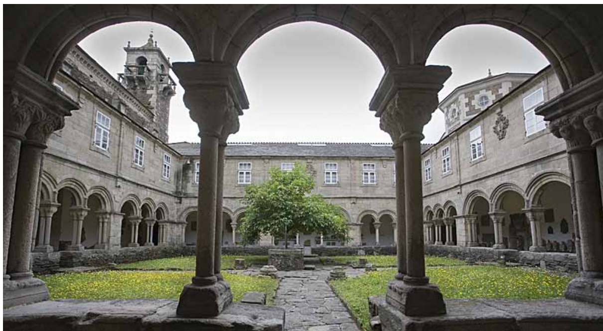
Fig. 8. Claustro interior del Museo Provincial de Lugo.