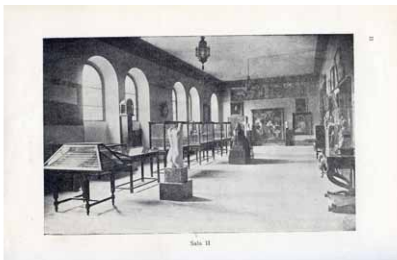
Fig. 4. Primera ubicación del MPL en el pazo de San Marcos. Foto: de la Guía del MPL, 1947.

La vocación arqueológica del MPL, además de estar implícita en la propia denominación inicial de la Institución, se incrementa al figurar como el espacio de recogida y custodia del patrimonio arqueológico según la normativa legal ya establecida en 1931 (Decreto de 22 de mayo de 1931 y 27 de mayo del mismo año) 11 , que especifica el procedimiento para depositar en los museos provinciales las obras en peligro, y también la Ley relativa al Patrimonio Artístico Nacional (13 de mayo de 1933) pensada para evitar la pérdida o el deterioro de bienes culturales. Sin embargo, esta regulación no establece las formas de «búsqueda» de materiales arqueológicos por lo que su aparición se limita sobre todo a la casualidad, con motivo de obras, remociones de tierra en yacimientos, etc.; en general son hallazgos fortuitos, por tanto, casi siempre descontextualizados. A este respecto hay que tener en cuenta la escasa implantación de la arqueología como disciplina científica aplicada al trabajo sistemático de campo; en esa época predominan las prospecciones superficiales sobre las excavaciones controladas, por consiguiente, los contextos de los yacimientos, cuando se conoce su procedencia, están