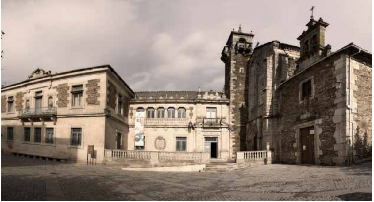
Fig. 7. Fachada principal actual del Museo Provincial de Lugo.

A través de esta peculiar iniciativa se incrementa también la colección de arqueología entre los años 1973 a 1979 con un total de sesenta y dos entradas en el libro de registro 12 .