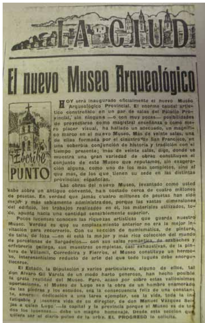
Fig. 6. Extracto del periódico El Progreso del 19-9-1957.

alterados y la información que nos ha llegado del origen de estas primeras piezas que se incorporan al Museo es escasa, sesgada e incluso poco fiable. Otras formas de ingreso, según el libro de registro del MPL, son las adquisiciones y los depósitos. Las cesiones también eran intermediadas o conducidas por los miembros de la Junta Rectora del Museo que promovían las gestiones necesarias para incrementar los fondos predicando con el ejemplo.