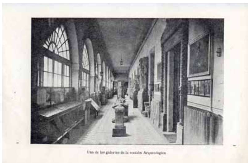
Fig. 3. Primera ubicación del MPL en el pazo de San Marcos.