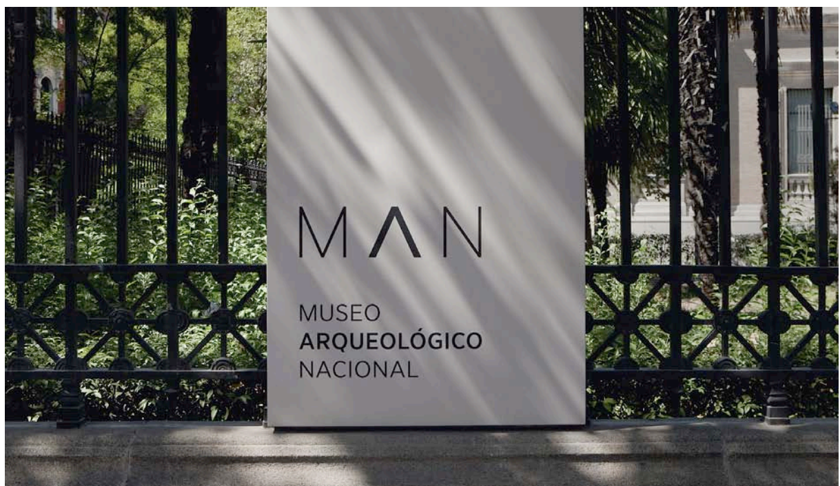
Fig. 1. Símbolo y logotipo definitivo y diferentes aplicaciones en el exterior del Museo.