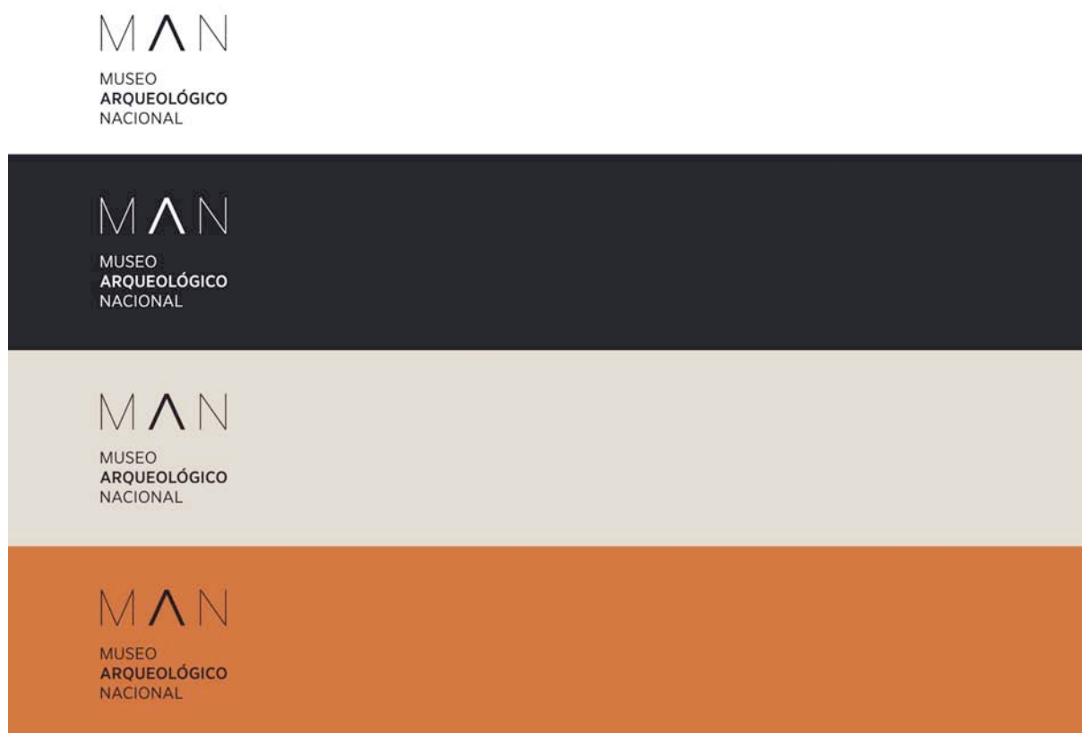
Fig. 5. Gama de colores definida para el Museo.