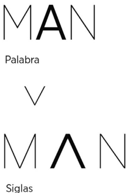
Fig. 2. Proceso de síntesis gráfica.