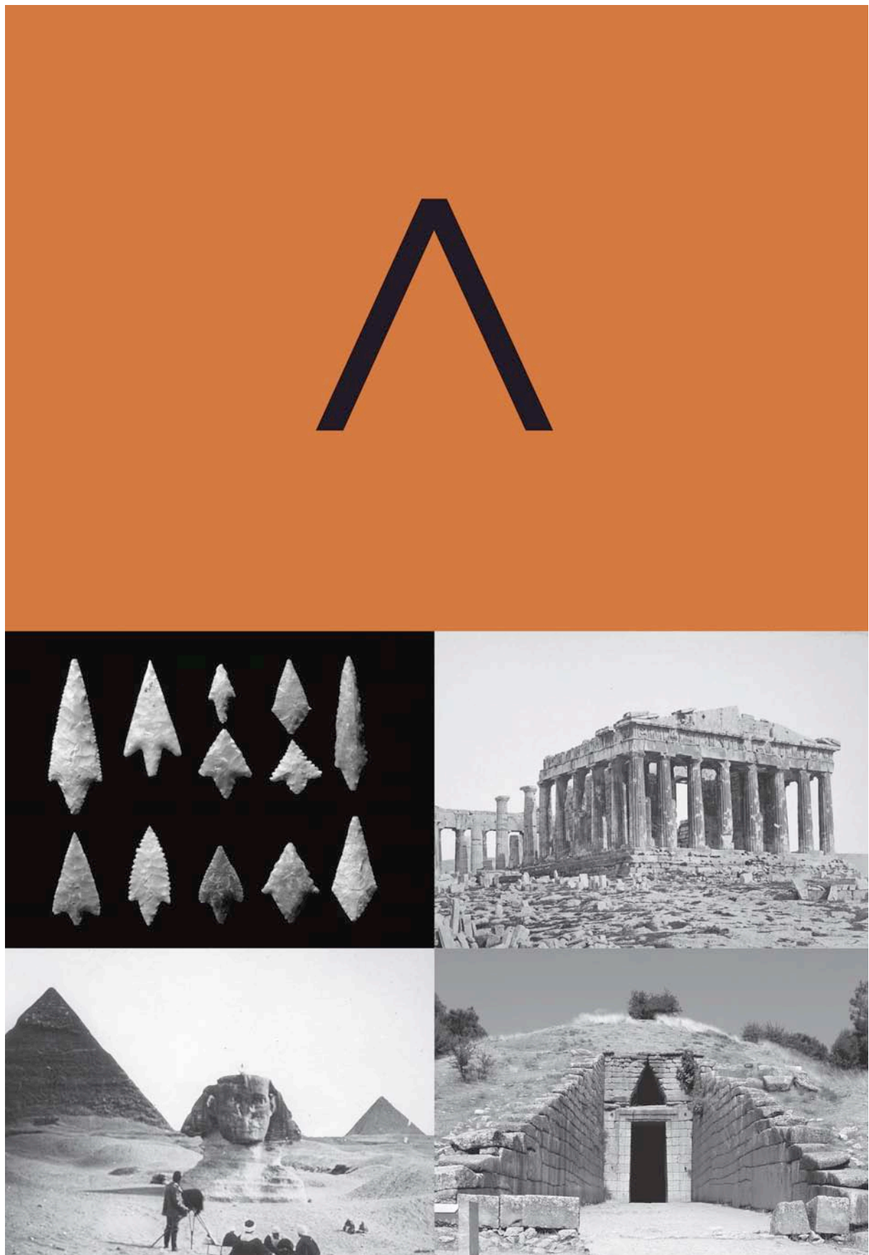
Fig. 3. Asociación conceptual entre el símbolo y diferentes períodos históricos.