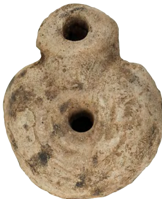
Fig. 5. Parte superior de la lucerna con la imagen muy desgastada de una rana.