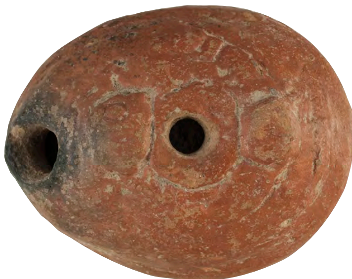
Fig. 6. Parte superior de la lucerna donde se aprecian levemente los rasgos de una rana.