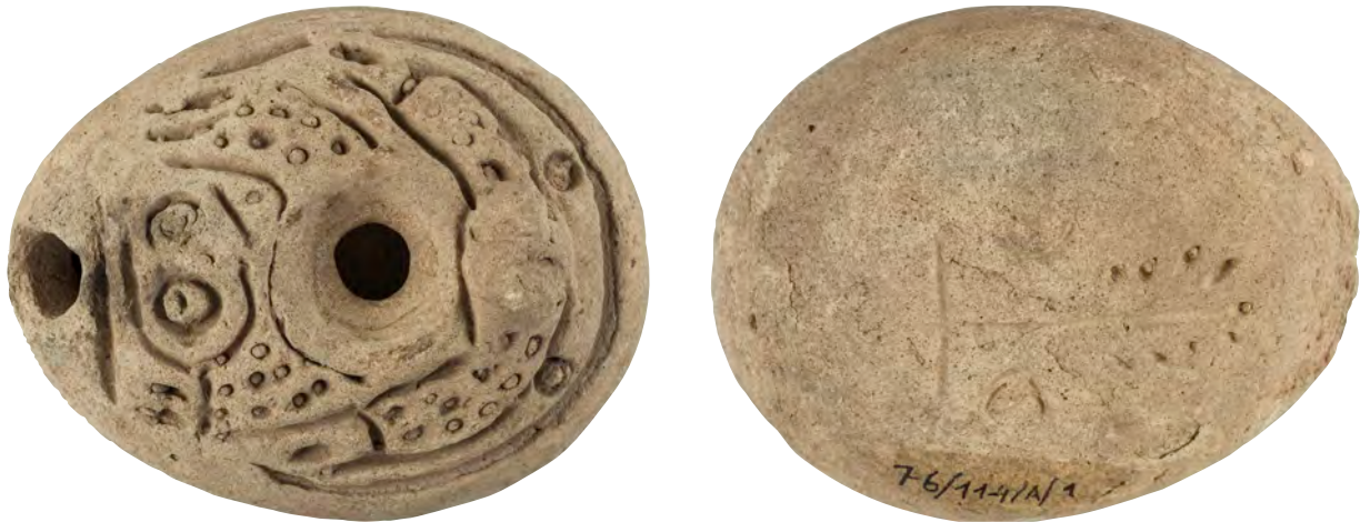
Fig. 3. A. Parte superior de la lucerna mostrando la imagen de una rana. B. Base de la lucerna con decoración incisa de una hoja de palma.

decoración en relieve de una rana cubriendo toda la superficie. Rasgos algo desgastados, destacando los ojos, las patas delanteras y el cuerpo a base de pequeños orificios rellenos. Carece de asa. Pasta y superficie color beige-verdoso, con pequeños poros debido a la utilización de material orgánico en su fabricación, algunos desconches y una pequeña rotura en un lateral. El orificio de iluminación conserva restos negruzcos por el uso. La base presenta una decoración incisa de hoja de palma con dos marcas en la parte inferior y otra en la parte superior del lateral derecho, todas a modo de media luna.