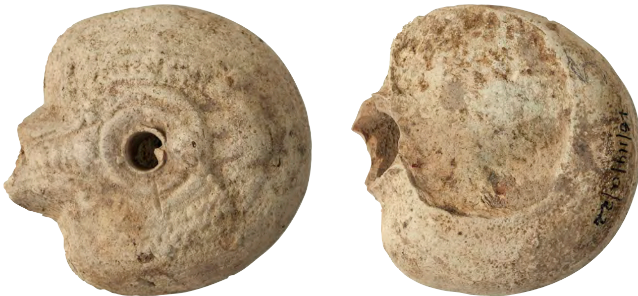
Fig. 7. A. Parte superior de la lucerna mostrando la imagen de una rana y parte del pico con volutas a los lados. B. Base de la lucerna fragmentada.

desgastados, si bien se distingue el medallón cóncavo en el centro, las extremidades posteriores dobladas y muy levemente el resto del cuerpo. Orificio central de alimentación cóncavo y con borde. El pico está roto, por lo que no es posible saber si tenía una terminación en yunque o redondeada. No obstante, todavía podemos distinguir el arranque de este con decoración de pequeñas rayas horizontales paralelas, y dos volutas a los lados. La base no tiene marcas de alfarero, y está algo rota. Medidas: 6,7 cm de longitud; 6,1 cm de anchura; 3 cm de altura; orificio de alimentación: 1 cm. Cronología: Finales siglo II - IV d. C.