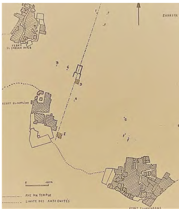
Fig. 2. Plano de la zona de trincheras cerca del templo de Herishef (López, 1974: 301, fig. 1).

A lo largo de estos años y según el acuerdo establecido por ambos gobiernos se procedió al denominado «reparto de excavaciones», ingresando en el Museo Arqueológico Nacional unos