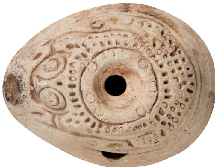
Fig. 4. Parte superior de la lucerna mostrando la imagen de una rana.

delimitados, destacando sobre todo, los ojos y las patas delanteras, mientras que el resto del cuerpo se representa a base de pequeños puntos incisos. Pasta y superficie color beige claro, con pequeños poros debido a la utilización de material orgánico en su fabricación, algunos desconches y una pequeña rotura en un lateral. El orificio de iluminación conserva restos negruzcos por el uso. No presenta marcas de alfarero en la base. Carece de asa.