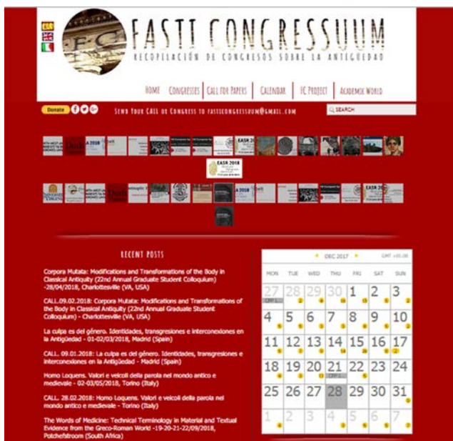
Fig. 1. Aspecto general de la web.

usuario y todas las redes sociales permiten tener un marco inmejorable para acercar la Antigüedad al gran público y para facilitar la comunicación entre investigadores. A día de hoy, se puede tener contacto virtual con miles de personas de todo el mundo, siendo esta la base de la difusión: se puede y se debe aprovechar lo bueno de las redes sociales y los aspectos positivos del mundo abierto para conseguir información, cribarla y devolverla de manera normalizada.