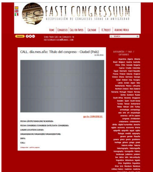
Fig. 2. Modelo de post de call for papers .

de Fasti Congressuum indicando un correo electrónico. Se ofrecen así diversos motores de búsqueda que permiten adaptarse a distintos niveles de usuario, priorizando la comodidad de la persona que accede a la web con unos conocimientos básicos de informática.