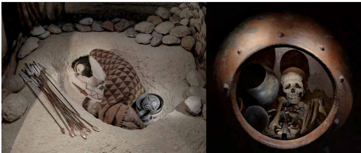
Fig. 5. A. Recreación de enterramiento campaniforme. B. Enterramiento en tinaja de El Argar, Edad del Bronce.

Para complementar este apartado, más dedicado al desarrollo cultural (tecnología y materiales utilizados, posibles contactos comerciales, similitudes de enterramientos, materiales que proceden de otras regiones, etc.) que a otros aspectos, el Dpto. de Difusión también realizó una presentación interactiva denominada ¿Sabías que...? Osteoarqueología: lo que nos cuentan los restos humanos , pensada como una serie de fichas didácticas que tratasen varios puntos fundamentales que pueden extraerse del estudio de los huesos.