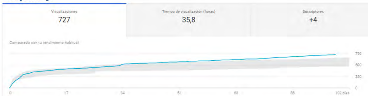
Fig. 8. Datos analíticos de los vídeos de tejeduría (visualizaciones).