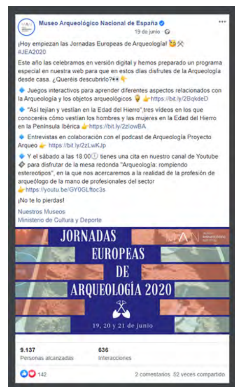
Fig. 1. Ejemplo de la difusión del programa de las JEA 2020 en una de las redes sociales del MAN (Facebook).

Al ser unas Jornadas desarrolladas íntegramente en formato digital, era necesario diseñar un apartado en la web que alojara todo el contenido y lo presentase de forma clara. Se creó un apartado dedicado a las JEA 1 en la sección de