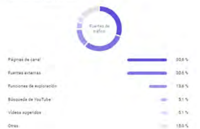
Fig. 9. Datos analíticos de los vídeos de tejeduría (fuentes de tráfico).

Tipos de fuentes de tráfico ▲ Visualizaciones Desde la publicación