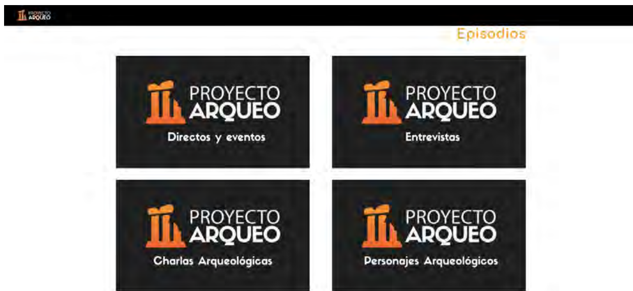
Fig. 2. Secciones de los episodios emitidos por Proyecto Arqueo.

con una suscripción, y escuchar posteriormente en cualquier dispositivo (ordenador, portátil, móvil, tableta...). De esta forma, aunque los contenidos del podcast pueden ser reproducidos en streaming , se ha ganado su fama por actuar como servicio a la carta. Una de las plataformas más utilizadas es iVoox, que permite subir archivos propios. En ella, los usuarios podrán crear una lista de favoritos, compartirlas y recibir sugerencias de producciones similares.