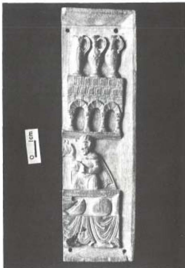
Placa de marfil, proveniente al parecer del arca de San Felices del Monasterio de San Millán de la Cogolla.