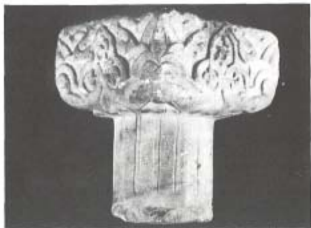
Capitel nazarí, en mármol blanco. Siglo XIV.