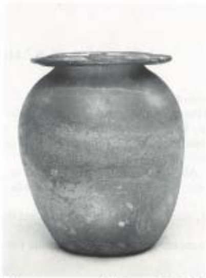
Fig. 8 N.º Inv. 26/15/280