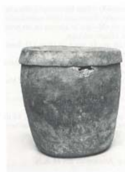
Fig. 20 N.º Inv. 17.098