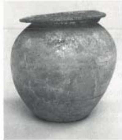
Fig. 3 N.º Inv. 17.099