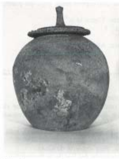
Fig. 10 N.º Inv. 80/67/1 y 2