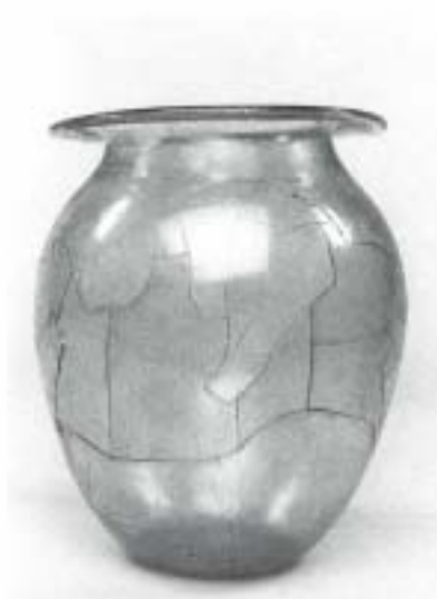
Fig. 14 N.º Inv. 1990/69/4