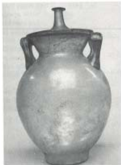
Fig. 18 N.º Inv. 1990/69/150