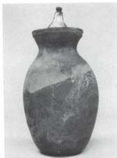
Fig. 15 N.º Inv. 14.278 urna N.º Inv. 1990/69/3 tapa