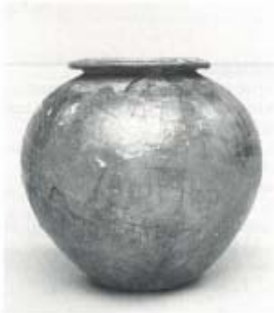
Fig. 2 N.º Inv. 14.281