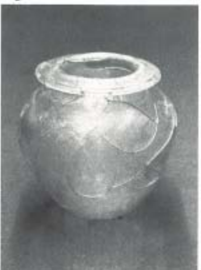
Fig. 8bis N.º Inv. 73/65/604