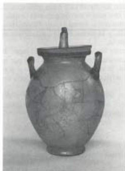
Fig. 17 N.º Inv. 1990/69/1