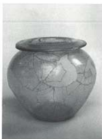
Fig. 6 N.º Inv. 20.057