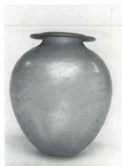
Fig. 7 N.º Inv. 26/15/25