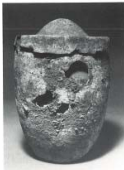
Fig. 23 N.º Inv. 1988/104/1 y 2