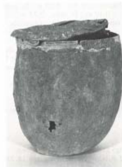
Fig. 22 N.º Inv. 80/67/5 y 6

Datos de interés: Tiene su correspondiente caja de plomo (n.º II).