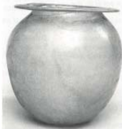
Fig. 1 N. o Inv. 14.279

Como ejemplo de esta situación presentamos el caso de la donación de tres de estas urnas por el Infante Don Alfonso de Borbón en 1907, cuyo texto aportamos en Apéndice, pero que al no aparecer descritas, no hemos