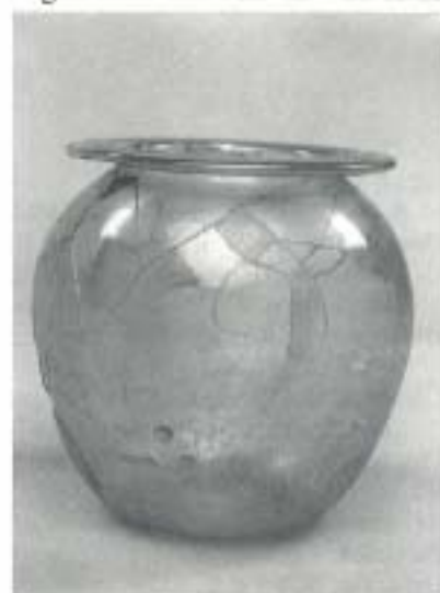
Fig. 9 N.º Inv. 73/65/607