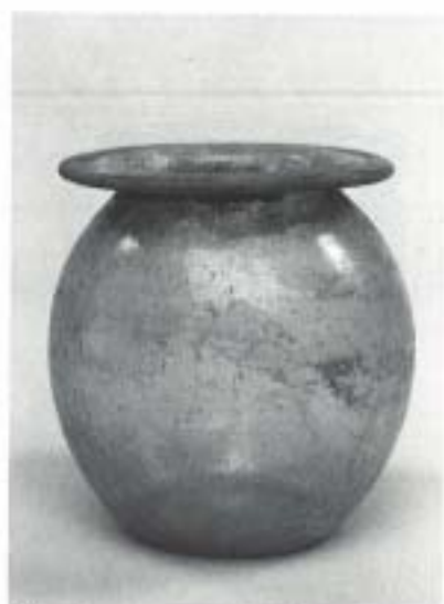
Fig. 5 N.º Inv. 20.050