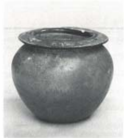
Fig. 4 N.º Inv. 19.048