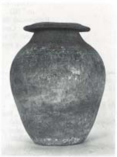
Fig. 11 N.º Inv. 80/67/3