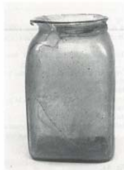
Fig. 19 N.º Inv. 14.280