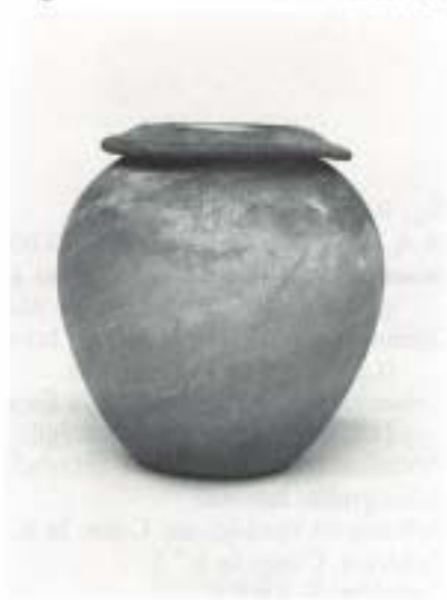
Fig. 13 N.º Inv. 1990/69/2