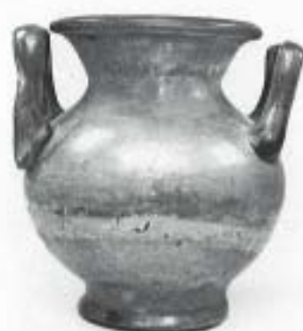
Fig. 16 N.º Inv. 14.277