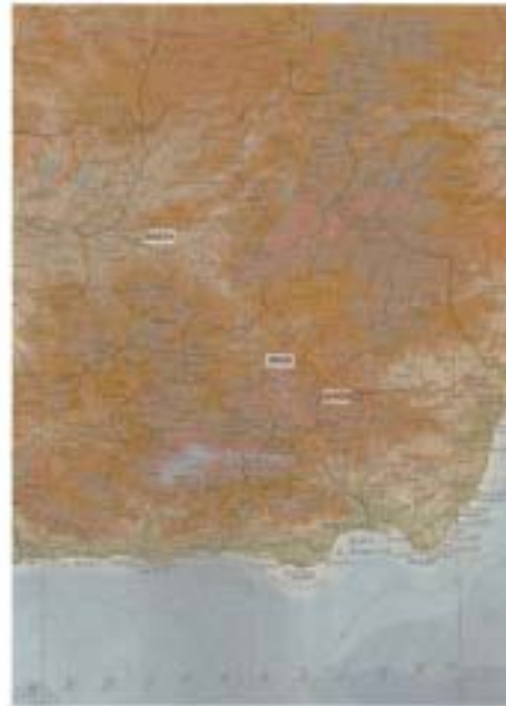
Figura 3. Mapa del área

El fragmento de cabo de cabezada de cabalgadura está compuesto de tres piezas de cobre esmaltado, de sección rectangular, huecas, para permitir el paso de la correa de cuero. La primera está decorada con tres palmetas apuntadas; la segunda, con tres círculos, y la tercera, de mayores dimensiones para conformar el remate del cabo, lleva un escudo inscrito en un círculo y palmetas. Del extremo apuntado, con decoración vegetal esquemática, penden un borlón y adornos de seda azul oscuro, dispuestos en tres haces. El interior del escudo es similar al emblema de los reyes granadinos, y están presentes en la arquitectura los palacios de la Alhambra y otras piezas procedentes de círculos palaciegos. Está relleno de esmalte azul.