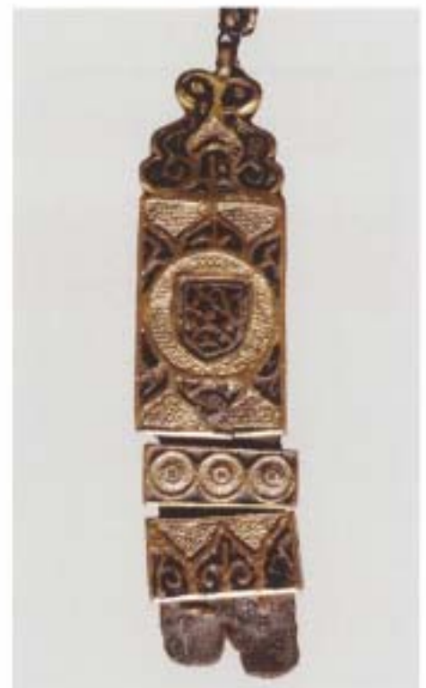
Figura 1. Fragmento de la cabezada de la «novia de serón». Museo Arqueológico Nacional.