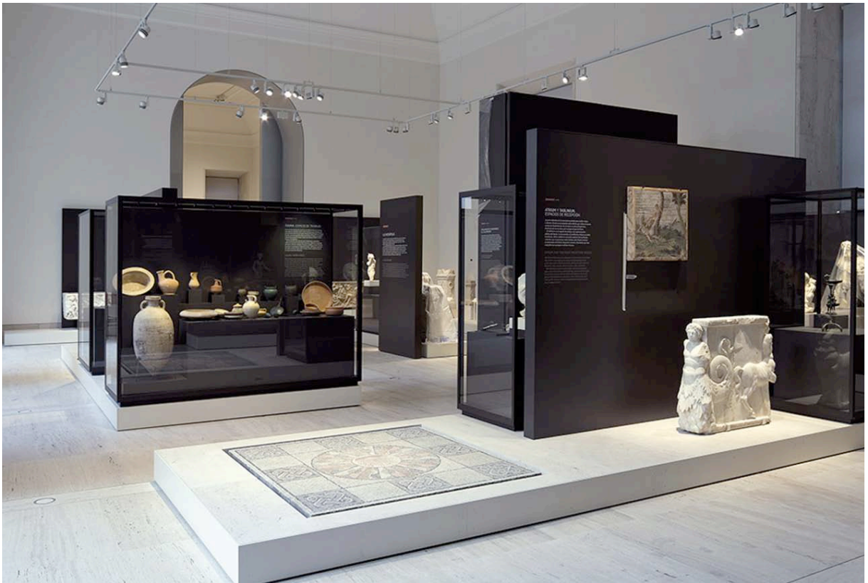
Fig. 6. Sala 21. La casa.

La unidad temática « Domus . La casa» (Fig. 6) muestra los espacios y los objetos característicos de la vida doméstica. Se sitúa en la sala posterior al Foro y se concibe como un microcosmos, espejo reducido de los espacios públicos de los que acabamos de venir. Entramos en el espacio doméstico. Su modelo espacial, centrípeto al atrio, es imagen de los progresivos niveles de intimidad entre visitantes y habitantes de la casa. La casa hispanorromana es