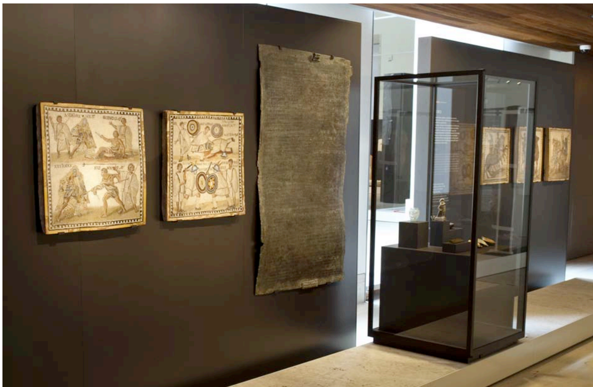
Fig. 5. Sala 19. «Juegos y espectáculos».

Su arquitectura fue un prodigioso despliegue de espacios, técnicas y propaganda. Teatros, anfiteatros y circos se difundieron ampliamente por las distintas provincias de Hispania.