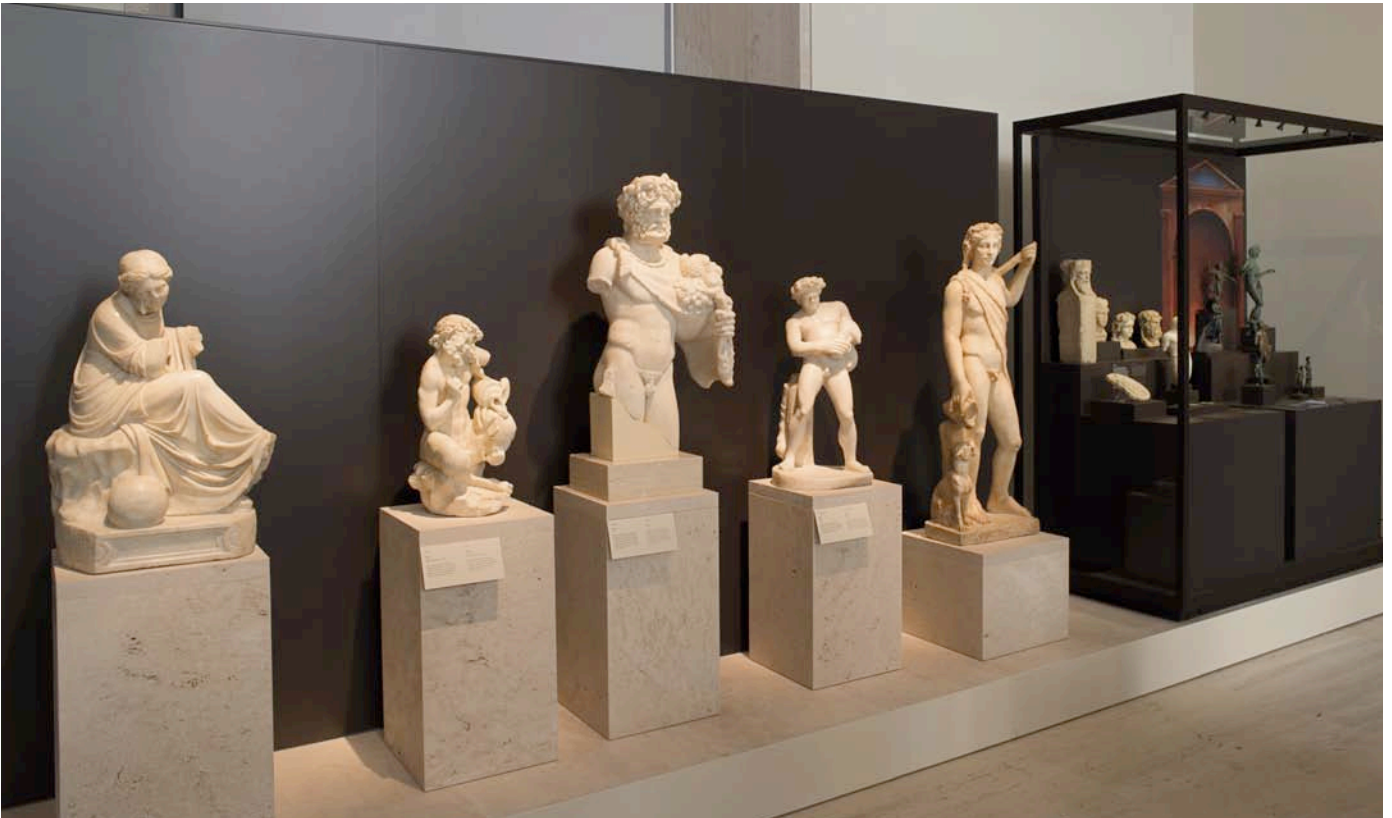
Fig. 7. Sala 21. Peristilo.