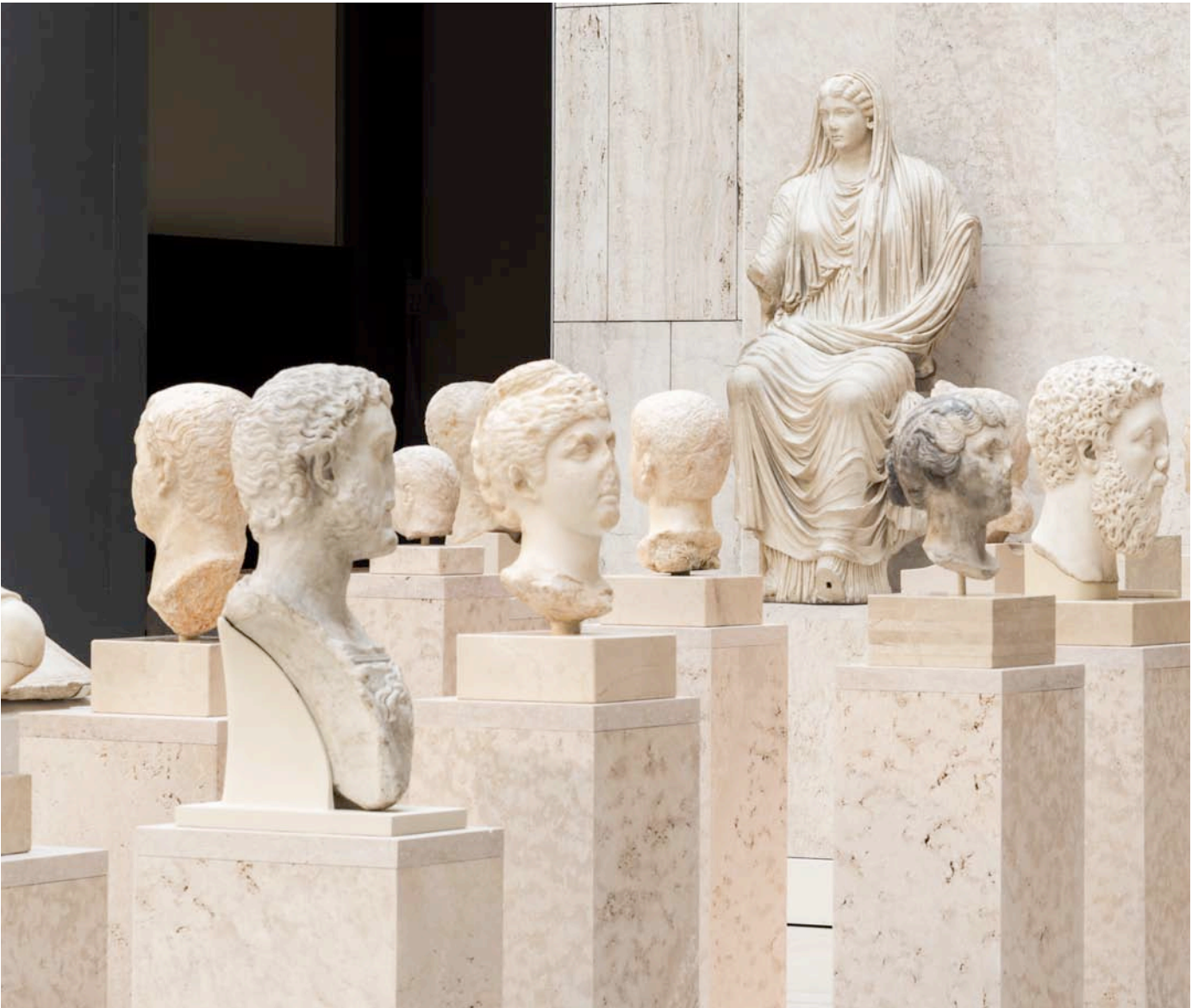
Fig. 3. Sala 20. «La imagen del Estado».

Esta unidad expositiva reúne retratos y esculturas del emperador y de su familia que allí se erigen, pues el Foro es el espacio urbano donde se despliega especialmente el lenguaje propagandístico y legitimador del poder. Las imágenes del emperador y de los miembros de su familia, multiplicadas por todo el territorio hispano, afirman el poder central y omnipresente del Estado.