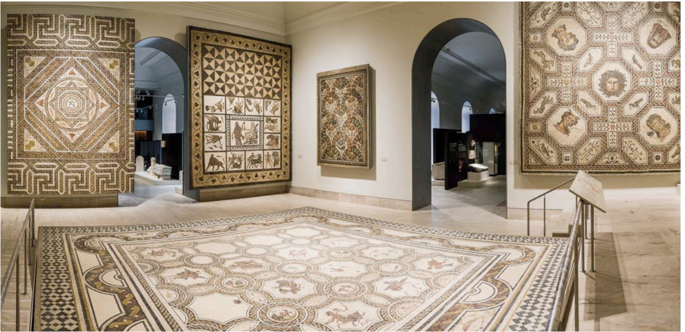
Fig. 9. Sala 22. El campo.

gobierno de las ciudades, reduciendo aquella autonomía que había sido la clave del dinamismo del sistema. Hispania deja de ser cada vez más centro de explotación, se encuentra marginada o al margen de los grandes problemas del Imperio y de sus ejes estratégicos o comerciales, que ahora se desplazan hacia el centro de Europa y hacia Oriente.