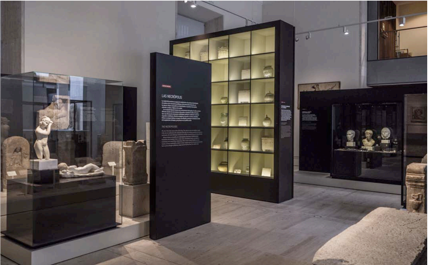
Fig. 8. Sala 21. «Las necrópolis».

Una vitrina expone objetos característicos de los ajuares funerarios hispanorromanos. Son los objetos cotidianos que los fallecidos llevarán en su último viaje y les acompañarán en su nueva morada en la otra vida: ungüentarios de vidrio o de cerámica, lámparas de aceite, objetos de adorno o de tocador, amuletos, vasos de ofrendas, juguetes, figuras de terracota, instrumentos de su profesión.