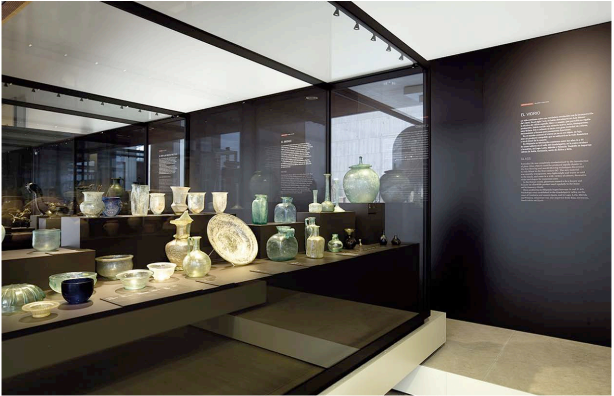
Fig. 4. Sala 19. «El vidrio».

esculturas para el culto doméstico, objetos de mobiliario, elementos de la vajilla de mesa, objetos de adorno personal y amuletos. La última vitrina de esta unidad temática exhibe piezas de orfebrería: collares, brazaletes, pulseras, anillos y sortijas de oro, joyas realizadas con perlas y piedras preciosas –esmeraldas, rubíes, granates, azabaches y zafiros–. Todos estos objetos son testimonio de la floreciente y dinámica actividad de los talleres artesanales y, al mismo tiempo, un magnífico reflejo de los más variados aspectos de la vida cotidiana en una ciudad hispanorromana.