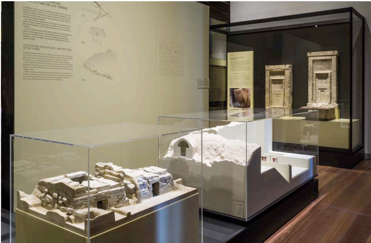
Fig. 4. Maquetas de Nefertari y de Tumbas del Tercer período intermedio (Heracleópolis Magna), Egipto.

Al igual que hemos visto en las salas anteriores, este discurso expositivo se ve fortalecido con paneles explicativos con textos, tanto fuera como dentro de las vitrinas, algunos de ellos con dibujos en acuarela como el de la «Estela de Orejas», o la tipología de tumbas nubias; paneles con dibujos a línea mostrando dioses egipcios y nubios, o los distintos tipos de tumbas egipcias (pirámides, mastabas e hipogeos); cartelas individuales y en conjunto, algunas de ellas con dibujos como el que muestra la disposición de los amuletos y escarabeos entre las vendas del difunto, las tobilleras en un enterramiento nubio o los conos funerarios en una tumba tebana.