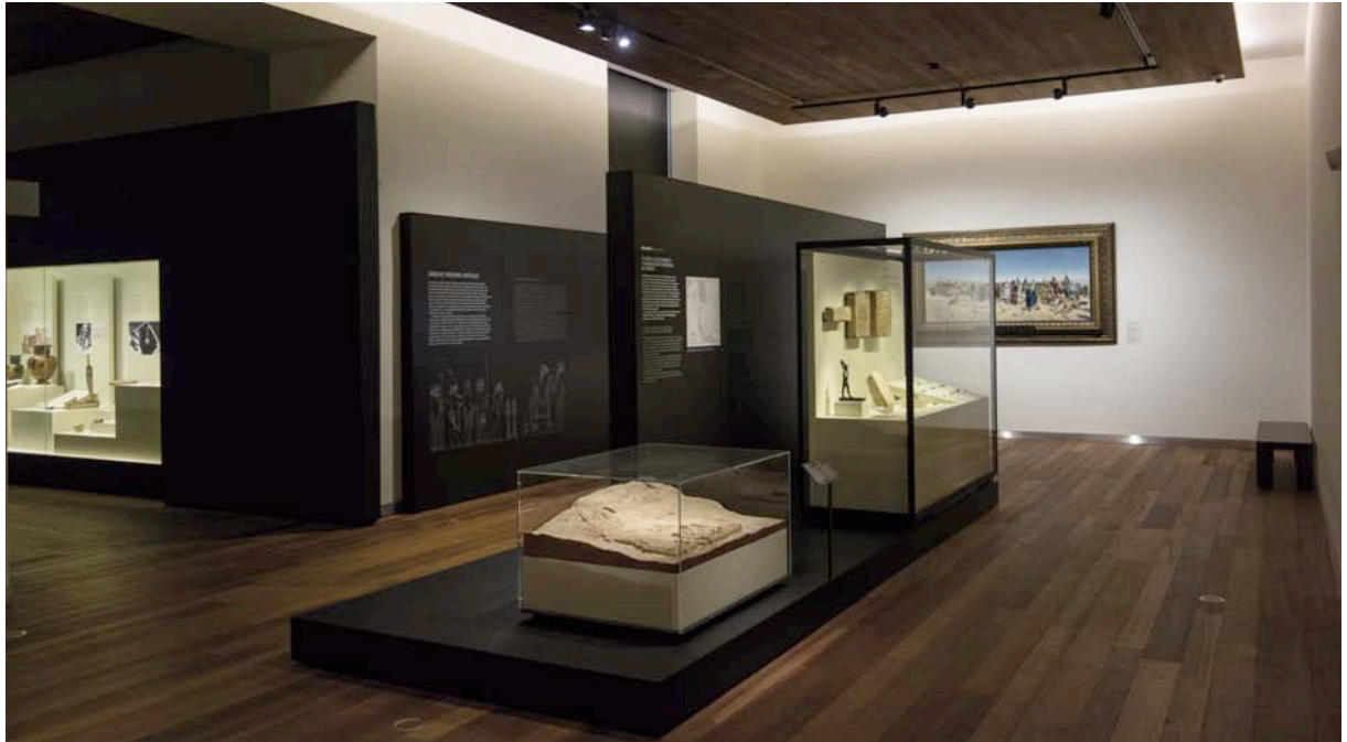
Fig. 1. Sala de Oriente Próximo.

También es cierto que hubiera sido muy interesante reforzar todo lo expuesto con fotografías a gran formato dispuestas en las paredes de la sala sobre yacimientos arqueológicos excavados por Misiones Españolas a lo largo del siglo pasado y el presente. Con ellas hubiéramos podido valorar y reconocer, desde el Museo, el ingente trabajo que durante muchos años han llevado a cabo nuestros investigadores, y que en nada tienen que envidiar a otros investigadores de fuera de nuestras fronteras. Esperemos que en un futuro no muy lejano este deseo se convierta en realidad (Fig. 1).