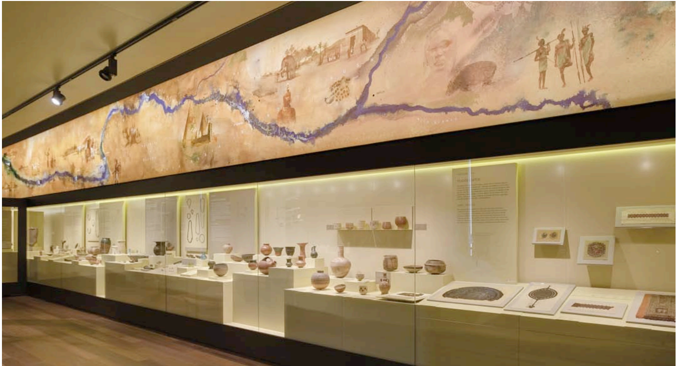
Fig. 3. Manufacturas en el Antiguo Egipto y Nubia.

La segunda zona de esta sala 33, se centra ya en la historia antigua de Egipto y Nubia (282 piezas). En ella se explica la «Vida Cotidiana» de estos dos países en la Antigüedad, teniendo como eje principal y común el río Nilo, la verdadera esencia de ambos.