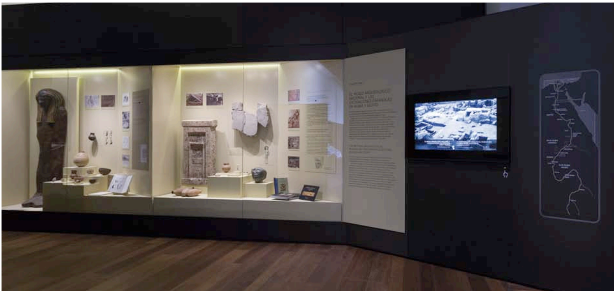
Fig. 2. Excavaciones españolas en Nubia y Heracleópolis Magna (Egipto).

Complementando todos los objetos de ambas vitrinas se han expuesto diversas fotografías de las excavaciones realizadas por los arqueólogos que trabajaron y trabajan en ellas, dibujos de piezas y de los propios yacimientos, hojas de diarios de excavación, publicaciones que muestran el resultado del estudio e investigación de los hallazgos, un mapa de Egipto y Nubia donde aparecen localizados los diferentes yacimientos arqueológicos, y finalmente un vídeo con texto escrito en castellano y en inglés que explica el origen de las excavaciones en Nubia y Heracleópolis Magna, el trabajo que se está llevando a cabo en este último yacimiento arqueológico, así como la llegada del templo de Debod a Madrid como regalo del Gobierno egipcio al Estado español en agradecimiento a la labor de salvamento de su patrimonio 10 (Fig. 2).