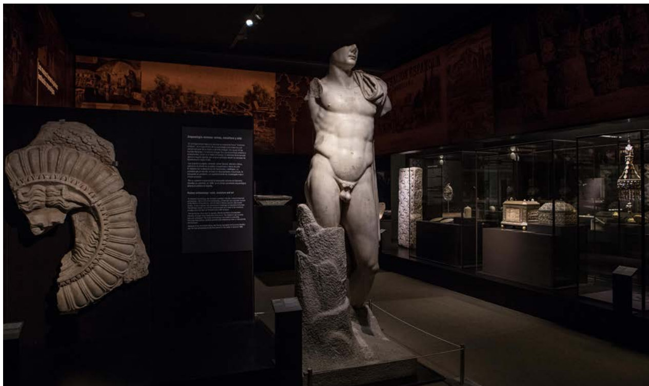
Fig. 4. Una de las salas de la exposición, con el Trajano de Itálica en el centro y a la izquierda un fragmento de clipeo procedente de Mérida.

la arqueología española, en unos casos por su valor artístico, en otros porque se trataba de objetos que resolvieron problemas de la investigación en un momento dado. Y también se incluyeron tesoros, «palabra mágica ligada innegablemente a la arqueología» lo que convirtió la exposición en un recorrido diverso con un especial interés en mostrar la evolución en estos 150 años de las técnicas de campo, desde excavaciones más rudimentarias del siglo XIX, –casi una simple extracción de objetos–, hasta las actuales donde se disecciona cada metro cuadrado con precisión, tomándose todo tipo de datos que se incluyen en soportes electrónicos y de muestras que son objeto de posteriores análisis científicos. En la exposición a través de audiovisuales se mostraba cómo trabajaban los arqueólogos, de qué forma documentaban y registraban los resultados de las excavaciones en cada etapa 11 .