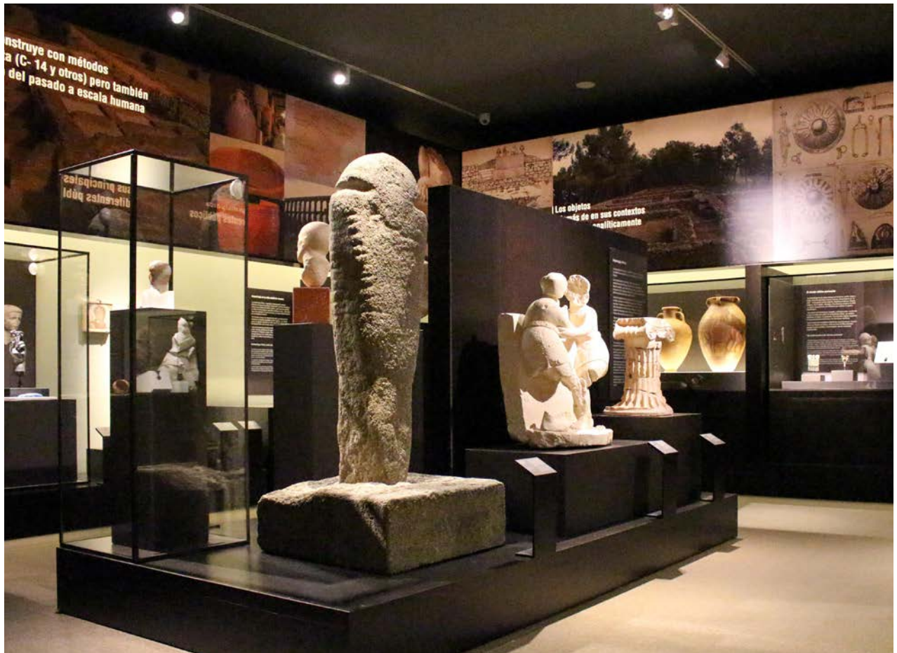
Fig. 7. Vista general de una de las salas de la exposición «El poder del pasado».