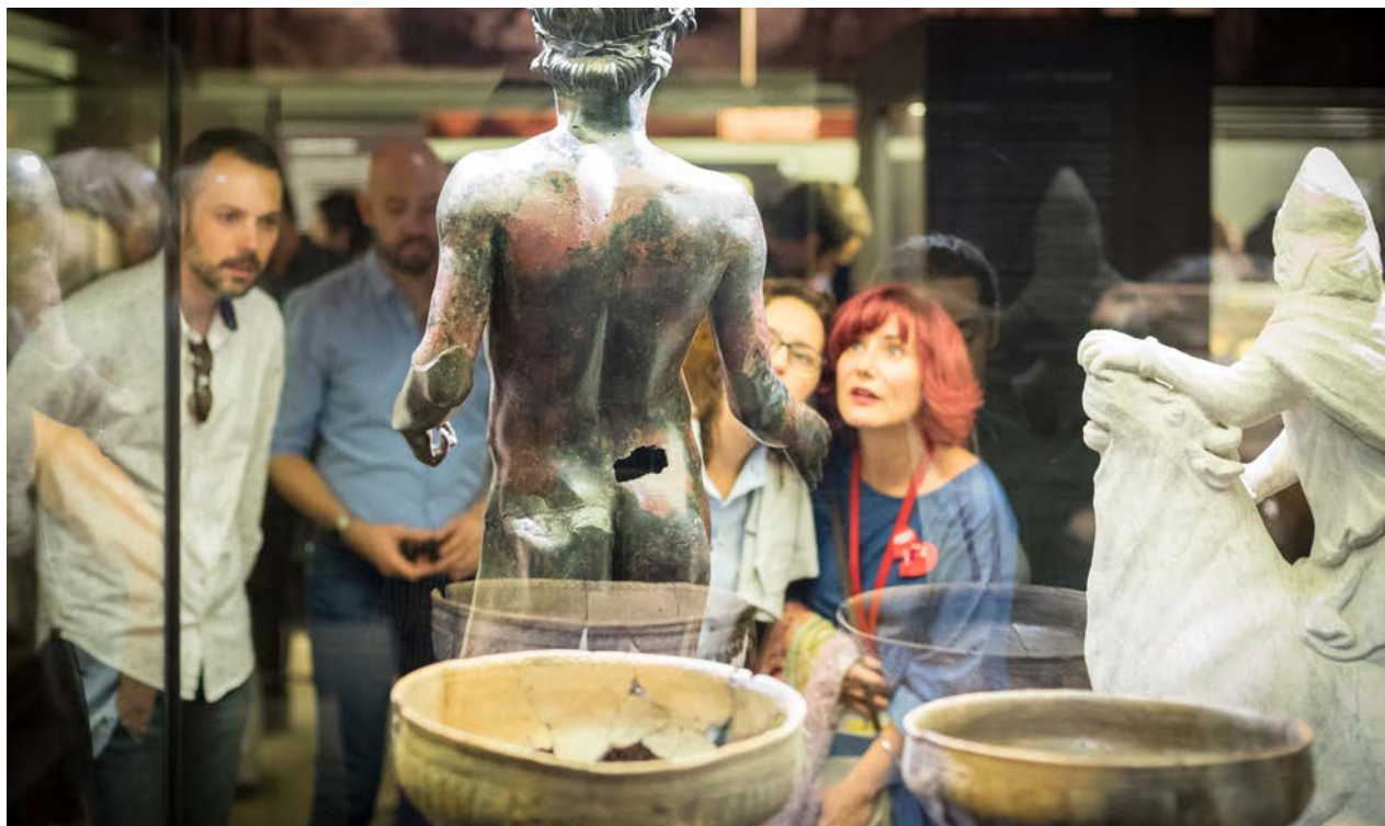
Fig. 8. Un grupo de visitantes contempla al Efebo de Antequera (Málaga).

con los que por primera vez se ha brindado una visión de conjunto de la arqueología en España durante el último siglo y medio, una historia del desarrollo de esta disciplina científica en nuestro país desde sus inicios hasta el presente. Hasta la publicación de este volumen, la reflexión escrita sobre la historia de la arqueología era parcial, en el sentido de estar referida solo a algunas etapas de nuestra arqueología, o por ser estudios regionales, o tratarse de estudios específicos sobre algunas especialidades.