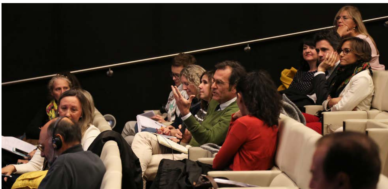
Fig. 11. Debate en las Jornadas «150 años de una profesión: de anticuarios a conservadores».

Al igual que en las conferencias realizadas al hilo de la exposición «El Poder del pasado», a través de la página web del MAN y del canal de YouTube, se puede tener acceso a las grabaciones de todas las intervenciones en estas Jornadas 17 . En la actualidad se está preparando la edición de sus Actas.