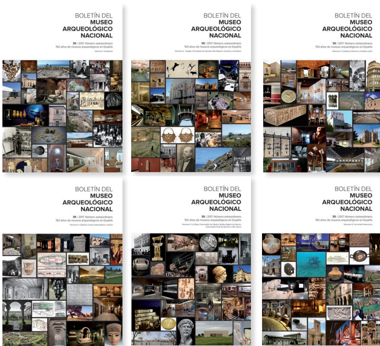
Fig. 12. Portadas de los seis volúmenes del número extraordinario del Boletín del Museo Arqueológico Nacional . Composición: Rubén Espada.

global nacional, al responder a convocatorias para museos de determinadas características 30 , o de alguna comunidad autónoma concreta, o analizadas solo bajo las premisas específicas del tema de algún congreso de historiografía.