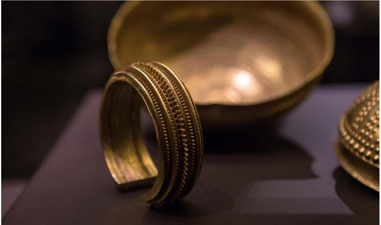
Fig. 6. Piezas del Tesoro de Villena, en primer plano uno de sus brazaletes.