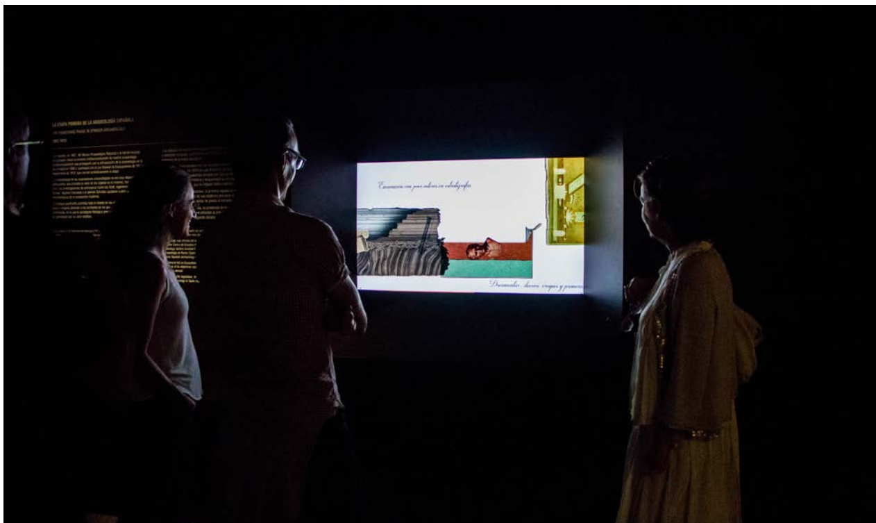
Fig. 5. Audiovisual en la exposición «El poder del pasado».