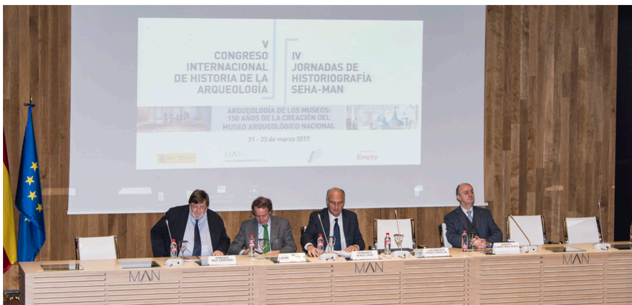
Fig. 1. Inauguración del V Congreso Internacional de Historia de la Arqueología / IV Jornadas de Historiografía SEHA-MAN.

Durante los tres días en los que se celebró el Congreso, más de un centenar de comunicaciones, conferencias y pósteres llenaron de contenido las sesiones de cada una de las ponencias, que dada la gran afluencia de participantes hubo que desarrollar en algunos momentos en sesiones paralelas en el salón de actos y la sala de conferencias del MAN. En su momento, al realizar la inscripción, se les solicitó a los participantes un somero curriculum y un resumen del trabajo que iban a presentar, con lo que se elaboró un Cuaderno de Resúmenes que se les facilitó al darles la bienvenida y acreditarse, y que resultó un instrumento muy útil para el seguimiento del Congreso.