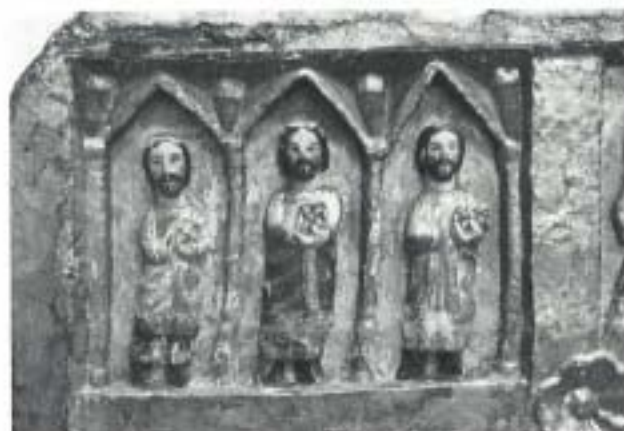
Fig. 1.—Detalle del frontal restaurado

Las operaciones realizadas fueron las siguientes: limpieza (aspirador, pincel), fijación de la policromía (Bedacryl L 122X - Xilol, cola de conejo y papel de seda), desinfección de la madera (Xilamón R), con-