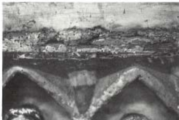
Fig. 2.—Arcos curvilíneos (detalle).