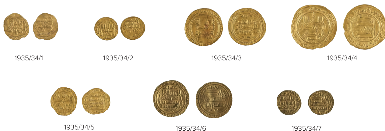
Fig. 2. Monedas compradas a Ramón Portillo el 3 de abril de 1935 y localizadas en el Museo Arqueológico Nacional. (Fotos: Ángel Martínez Levas, MAN).