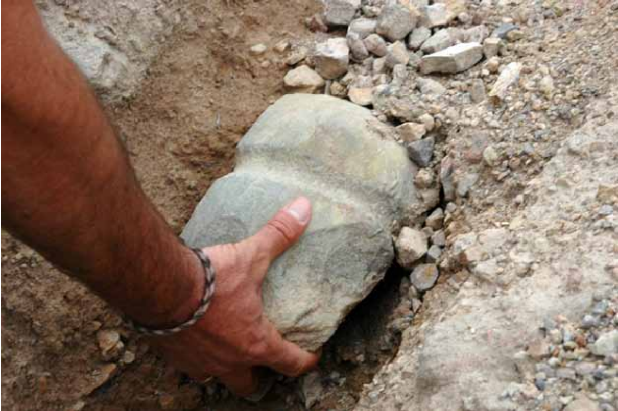
Fig. 1. Gran martillo de escotadura recuperado en el entorno del Cerro de la Ermita, en el Sitio Histórico de Cerro Muriano.