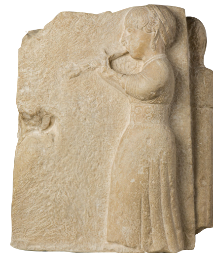
Piedra caliza | Cultura ibérica | Siglos III-I a.C. | Osuna (Sevilla)

Este relieve representa a una auletrix , o intérprete de aulós . El aulós es un instrumento musical de viento con lengüeta cuyo origen se remonta al III milenio a. C. en Egipto, Mesopotamia y las Islas Cícladas. En la península ibérica su presencia ha sido documentada a partir del siglo V a. C. a través de la iconografía de los vasos griegos de figuras rojas. Posteriormente, su representación se ha localizado también en piezas cerámicas, metálicas y pétreas de la cultura griega, púnica e íbera. Dicha iconografía muestra que las intérpretes eran mayoritariamente mujeres (las «auletrices») y que predominaba en ámbitos rituales.