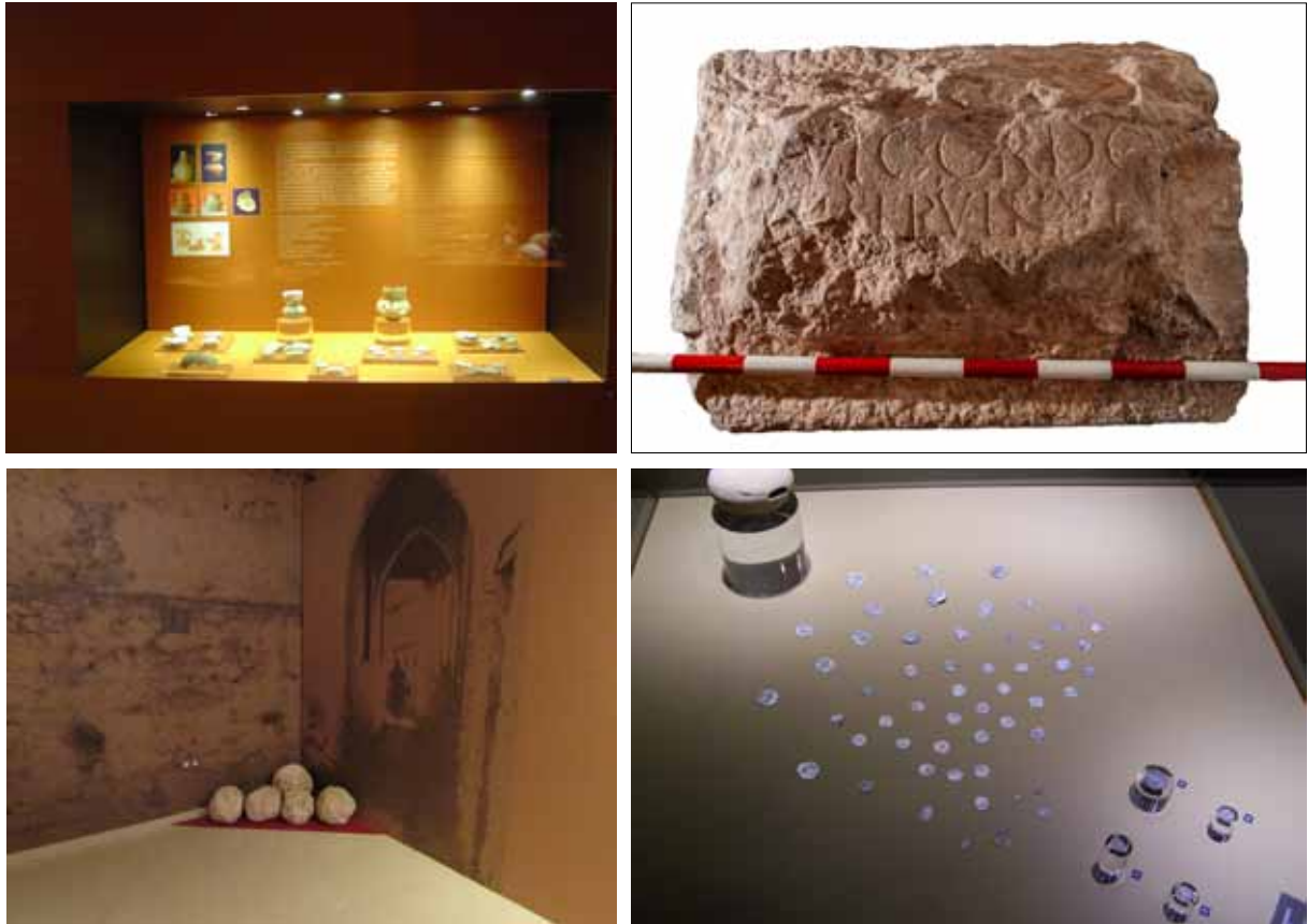
Fig. 6. Sala Sucro . Cerámica islámica. Fig. 7. Sala Sucro . Inscripción romana. Fig. 8. Sala Sucro . Proyectiles. Fig. 9. Sala Sucro . Tesorillo siglos XIII-XIV.