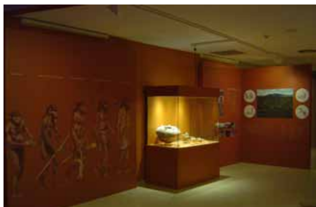
Fig. 2. Corredor del MUMA. Fig. 3. Ventana geminada. Fig. 4. Zócalo de un muro de época almohade. Fig. 5. Sala Sucro. Prehistoria.

medieval de la Vila, y de este modo, se concibió como un elemento más añadido al diálogo expositivo. A través de ventanas arqueológicas en los muros de tapial y en el pavimento se puede estudiar la tipología de la construcción y las fases evolutivas, con simulación de los estratos formados por rellenos de la ocupación humana y la aportación de sedimentos fluviales, a consecuencia de las continuas inundaciones del Júcar (Xúquer), que han dejado capas de aluviones en esta ciudad asentada en medio de su cauce. En determinadas partes del edificio, se pueden seguir vestigios arquitectónicos de las diferentes etapas de ocupación, como en los muros de tapial, los arcos apuntados o de medio punto, los arcos geminados o los canecillos que asoman de las paredes, entre otros elementos que en conjunto indican la importancia de este antiguo caserón.