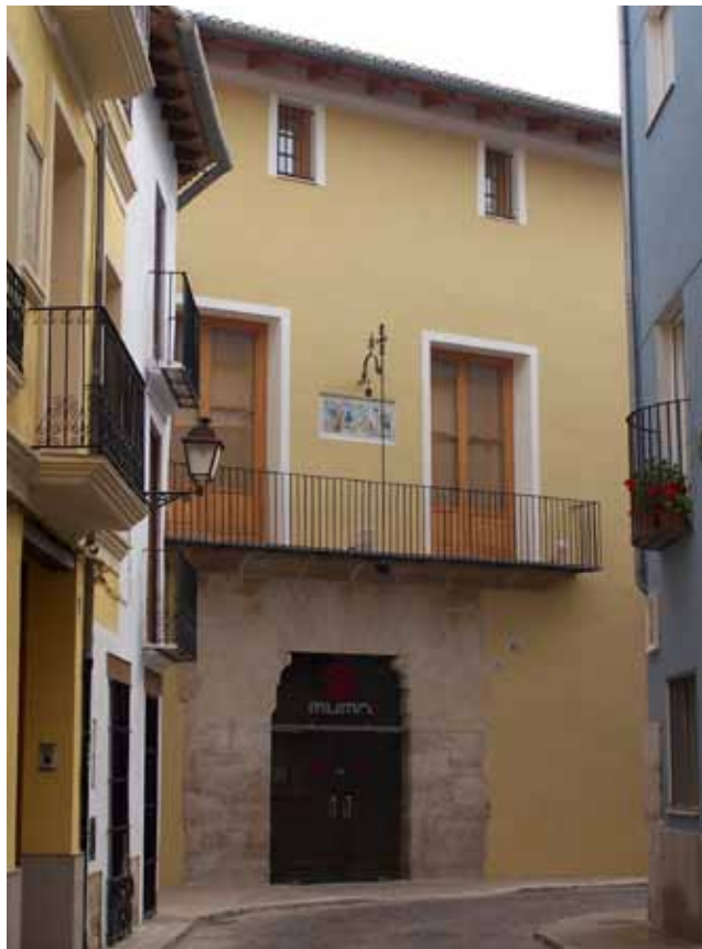
Fig. 1. MUMA, Sant Roc, 16.

El Museu Municipal d'Alzira fue reconocido por la Generalitat Valenciana el 15 de febrero de 1994, como centro de recuperación, conservación, estudio y divulgación de los bienes histórico artísticos y culturales de Alzira 2 . Empezó a gestarse a finales de los años 70 como una necesidad de recuperar y conservar los bienes arqueológicos y etnológicos, evitando su pérdida o dispersión. En 1978 el Ayuntamiento aprobó su puesta en marcha, ubicándose en el edificio de las antiguas Escuelas Pías (siglo XIX), siendo aprobada su constitución por el Pleno del Ayuntamiento el 20 de noviembre de 1980. Desde el inicio, la labor del Museo fue destacada, contribuyendo a la protección del yacimiento arqueológico de la Muntanya Assolada, un despoblado de la Cultura del Bronce Valenciano que ha sido clave en el conocimiento de este periodo cultural, gracias a las campañas arqueológicas realizadas por el Servicio de Investigación de Prehistoria (SIP).