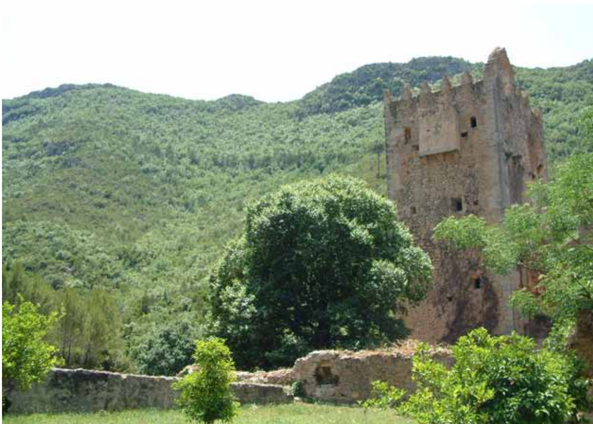
Fig. 10. Ruinas monasterio de la Murta. Torre de las Palomas.

cerámicas esgrafiadas, algunas con interesantes alafias 6 ; proyectiles de piedra utilizados en la defensa de la ciudad amurallada; e incluso un tesorillo de monedas de plata y de vellón de los siglos XIII-XIV 7 halladas en una excavación de la Vila, en el interior de una hucha de cerámica.