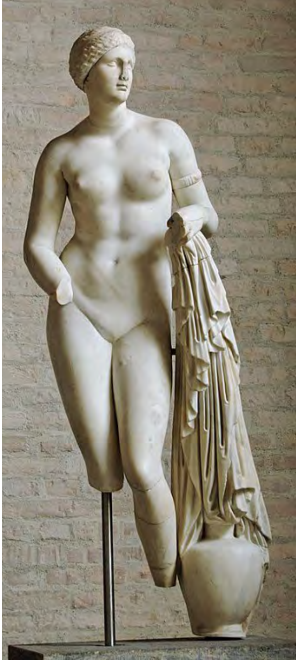
Fig. 3. Afrodita conservada en la Gliptoteca de Múnich. https://commons.wikimedia.org/wiki/File:Aphrodite_Braschi_Glyptothek_Munich_258.jpg

figura de la diosa para con ello conocer su adscripción a un ambiente doméstico o bien oficial. Para llegar a conocer la altura total de la figura debemos tomar las dimensiones del único elemento conservado, la jarra de agua, y cotejarlas con las de otras esculturas similares desde el punto de vista tipológico que conserven este atributo. Pero para que nuestra indagación sea válida, no podemos admitir otro tipo de recipiente que sea distinto al aquí presente; es por ello por lo que no tendremos en consideración el loutrophoros o jarrón de boda, dado que es mucho más alto que nuestra hydria y, en consecuencia, las proporciones se verían alteradas; tampoco tomaremos en consideración aquellos ejemplos que tengan un delfín como elemento de apoyo. A pesar de la diversidad a la hora de representar a la hydria en algunas réplicas conservadas (algunas más altas,