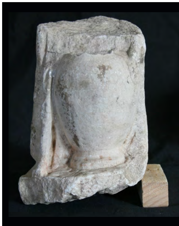
Fig. 2. Vista frontal de una hydria en mármol. Museo Arqueológico de Córdoba.

La Afrodita conocida como Cnidia, la más bella obra de Praxíteles según Luciano ( Amores , 11-14), fue la primera que en la antigüedad representó a la diosa desnuda convirtiéndose en un referente, por lo que fue muy copiada con posterioridad. Aunque no contamos en nuestro fragmento con