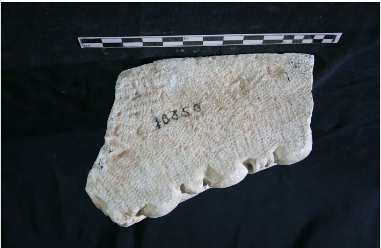
Figs. 4 y 5. Vista frontal y superior de un fragmento de ábaco decorado. Museo Arqueológico de Córdoba.