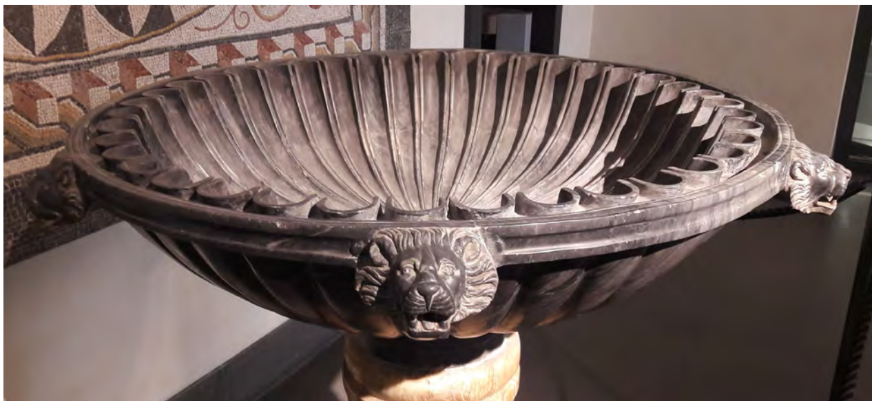
Fig. 9. Labrum conservado en el Museo Nazionale Romano, sede Palazzo Massimo alle Terme.