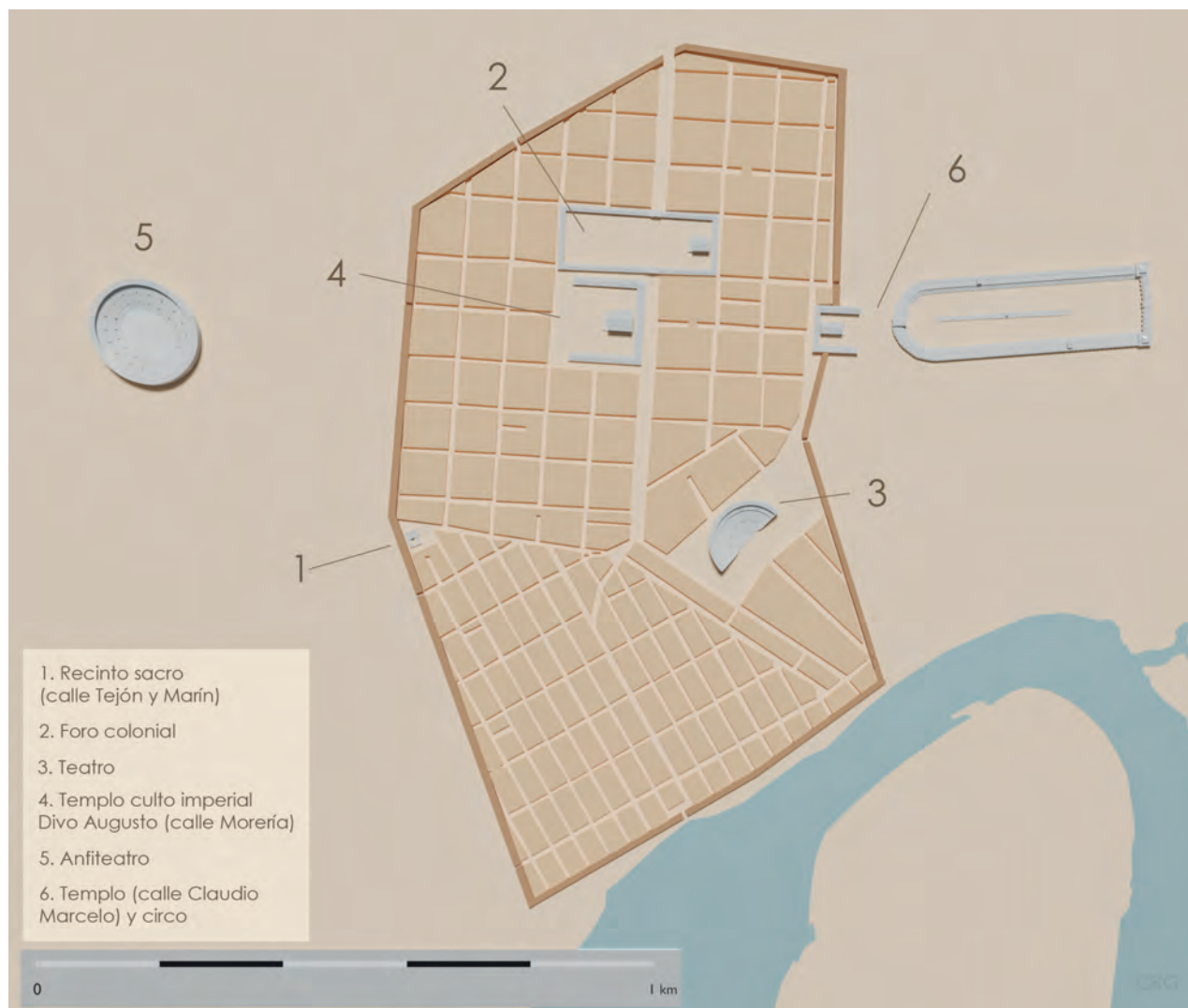
Fig. 10. Planta de la ciudad romana de Córdoba en el periodo altoimperial. Modelo virtual realizado por Carmen Rodríguez con la colaboración científica de Massimo Gasparini.