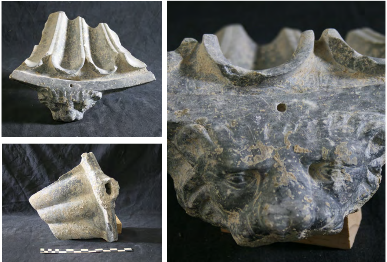
Figs. 6-8. Fragmento de labrum . Museo Arqueológico de Córdoba.

Varios elementos son destacables en esta pieza: por un lado, el tipo de decoración para la salida del agua en forma de cabeza de felino, algo poco frecuente y solo presente en aquellas piezas de mayor relevancia dentro de este tipo particular de fuente (Ambrogi, 2013); a este signo de prestigio debe responder también el orificio que se encuentra en el borde de la fuente, justo detrás de la cabeza y que serviría con toda probabilidad para añadir un aplique metálico que reforzaría el valor ornamental de la fuente. Además, el material en que está elaborada es un mármol negro con pequeñas vetas grises, sin lugar a dudas material importado, aunque no se puede asegurar si se trata de Göktepe negro (Lapuente; León, y Nogales, 2013: 215) o más probablemente bigio morato/nero antico (Pensabene, y Lazzarini, 1998); el hecho de ser mármol importado es importante no solo por las implicaciones económicas y comerciales que ello pueda conllevar, sino porque apunta en la dirección de considerar nuestra fuente como pieza importada.