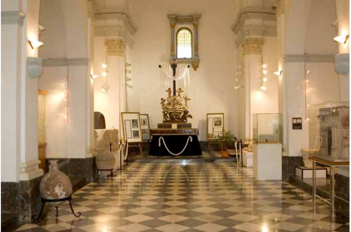
Fig. 3. La iglesia de San Juan de Dios, actual sede del Museo Arqueológico Comarcal.

concesión de licencias. Eso hará posible el desarrollo de la arqueología urbana, favorecida además por el auge urbanístico. El propio Museo asumirá la realización de excavaciones en terrenos públicos.