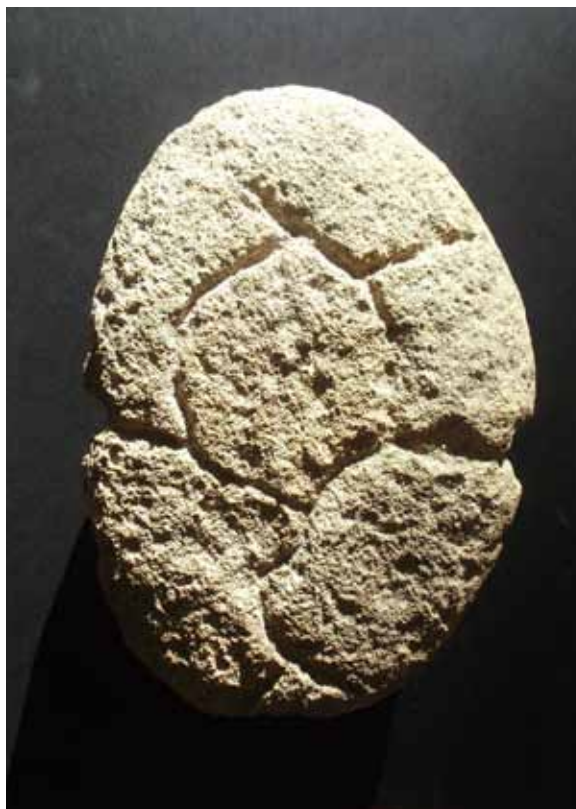
Fig. 4. «Ídolo de Orihuela», Bronce Final. Una de las últimas donaciones al Museo.

La reciente creación de la Asociación de Amigos del Museo Arqueológico ha abierto nuevas vías para la participación ciudadana y nos permite encarar el futuro con optimismo.