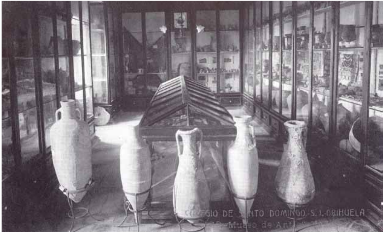
Fig. 1. Museo de Antigüedades del Colegio de Santo Domingo. (Inicios del siglo xx).

Podemos considerar distintas etapas en la historia del Museo, que han sido fuertemente influenciadas por el contexto histórico, político y cultural de cada momento y por las personas que han colaborado en su gestión.