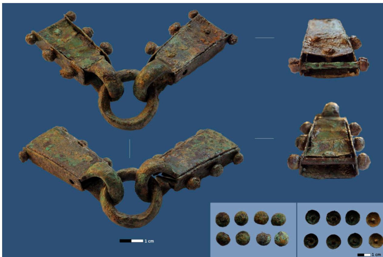
Fig. 2. Pieza de arnés de El Castrico y las ocho tachuelas aparecidas junto a ella. La restauración fue llevada a cabo por Rebeca de la Cruz García en 2021.

Técnica y estilísticamente, el hallazgo pertenece exactamente al mismo grupo que el conjunto proveniente de la necrópolis de Eras del Bosque (Palencia), hoy expuesto en el Museo Arqueológico Nacional 5 (Fernández, 2021), en el que vemos varios ejemplos de anillas con solo dos presillas ancladas, en vez de tres o más, que es lo más habitual (Bishop, 1988; Aurrecoechea, 2007). Otro ejemplo sería una pieza 6 hallada en las proximidades de Lancia, en la localidad leonesa de Villasabariego (Fernández, 2021). Lamentablemente ambos casos carecen de contexto arqueológico.