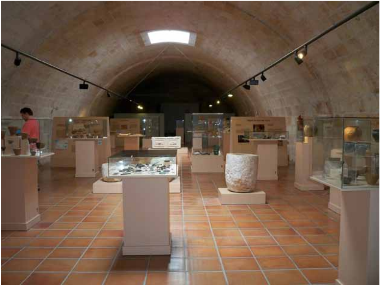
Fig. 1. Vista general de la sala de exposiciones permanente del Museo.

El actual Museo Municipal de Ciutadella se inscribe dentro del núcleo histórico de dicha ciudad y está ubicado en un antiguo baluarte que formaba parte de la línea de muralla que durante la Edad Media y Moderna protegía la ciudad de posibles ataques exteriores. Nos encontramos, por tanto, ante un Museo ubicado en un edificio histórico de singular belleza y catalogado como Bien de Interés Cultural (BIC), la máxima categoría de protección que pueden ostentar los bienes integrantes del patrimonio histórico.