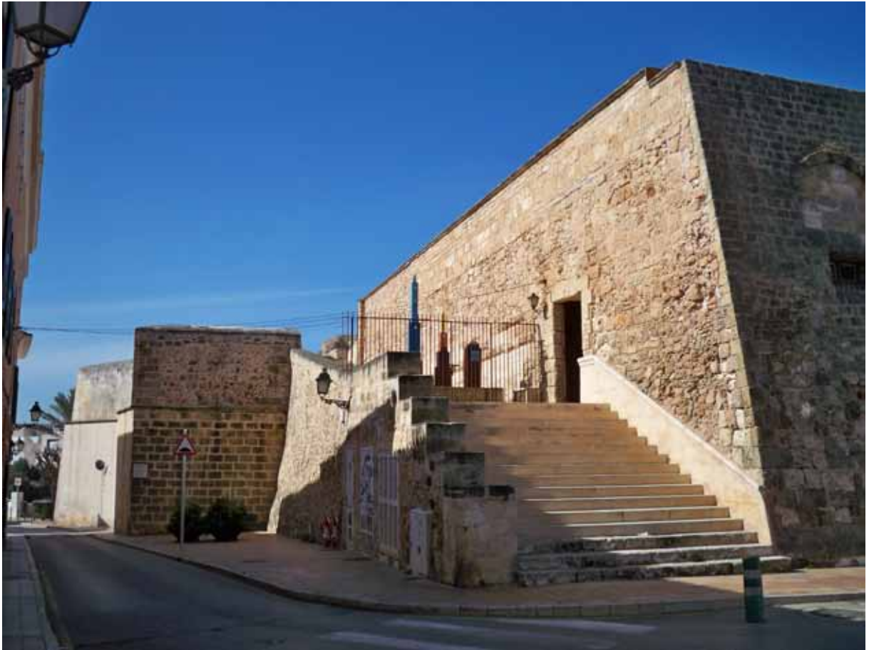
Fig. 3. Vista exterior de la entrada actual del Museo con sede en el Bastió de Sa Font.

obras de restauración del inmueble financiadas por el Ministerio de Cultura. Los materiales del antiguo Museu Histórico-Artístico de Ciutadella permanecen almacenados en diferentes dependencias municipales hasta 1994, hecho que provoca un movimiento constante e incontrolado de sus fondos. Durante estos años se produce también una entrada de pequeños lotes de materiales arqueológicos en la Institución debido a diferentes obras realizadas en el casco antiguo, tanto por parte de particulares como del propio Ayuntamiento. A día de hoy estos pequeños lotes conforman, junto a todas las donaciones anteriores al 1995, la colección de antiguos fondos del Museo Municipal.