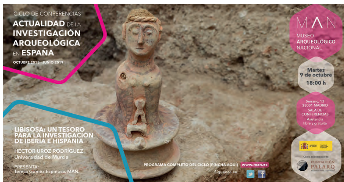
Fig. 4. Diseño para la difusión del ciclo con la imagen del yacimiento de Libisosa. Diseño gráfico: Raúl Areces.

Javier Andreu Pintado y excavada en los diez últimos años. El asentamiento se sitúa entre la colonia de Caesar Augusta y la antigua Pompelo (Pamplona) y estuvo dotado de todos los equipamientos propios de las ciudades romanas.