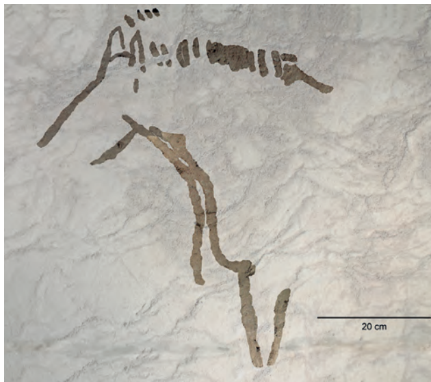
Fig. 3. Caballo de la cueva de Ekain (Deba, Gipuzkoa).

Por último, también hemos recogido investigaciones realizadas por algunos centros vinculados a universidades, como el caso del Centro de Evolución y Comportamientos Humanos vinculado al Instituto de Salud Carlos III y a la Universidad Complutense de Madrid. En estos últimos casos es interesante destacar los proyectos colaborativos, como modelo investigador que favorece la cooperación entre instituciones de diversa procedencia y dependencia administrativa.