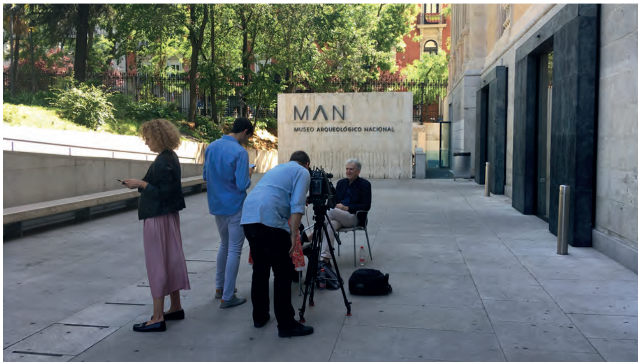
Fig. 2. Juan Luis Arsuaga en el Museo Arqueológico Nacional.

Pero no hay que olvidar la diversidad de temas propuestos y la curiosidad que todavía suscitan entre el público. Los neandertales de El Sidrón (Asturias), la Neápolis griega de Emporion o la Guerra Civil contada mediante un hilo conductor articulado a través diez objetos muestran la diversidad de los intereses de los asistentes. La investigación arqueológica goza de buena salud. Despierta interés y curiosidad entre un público que muestra sus deseos de acercarse a nuestra disciplina desde una perspectiva rigurosa, pero también amena.