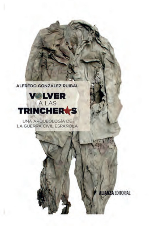
Fig. 5. Portada del libro Volver a las trincheras , de A. González Ruibal.