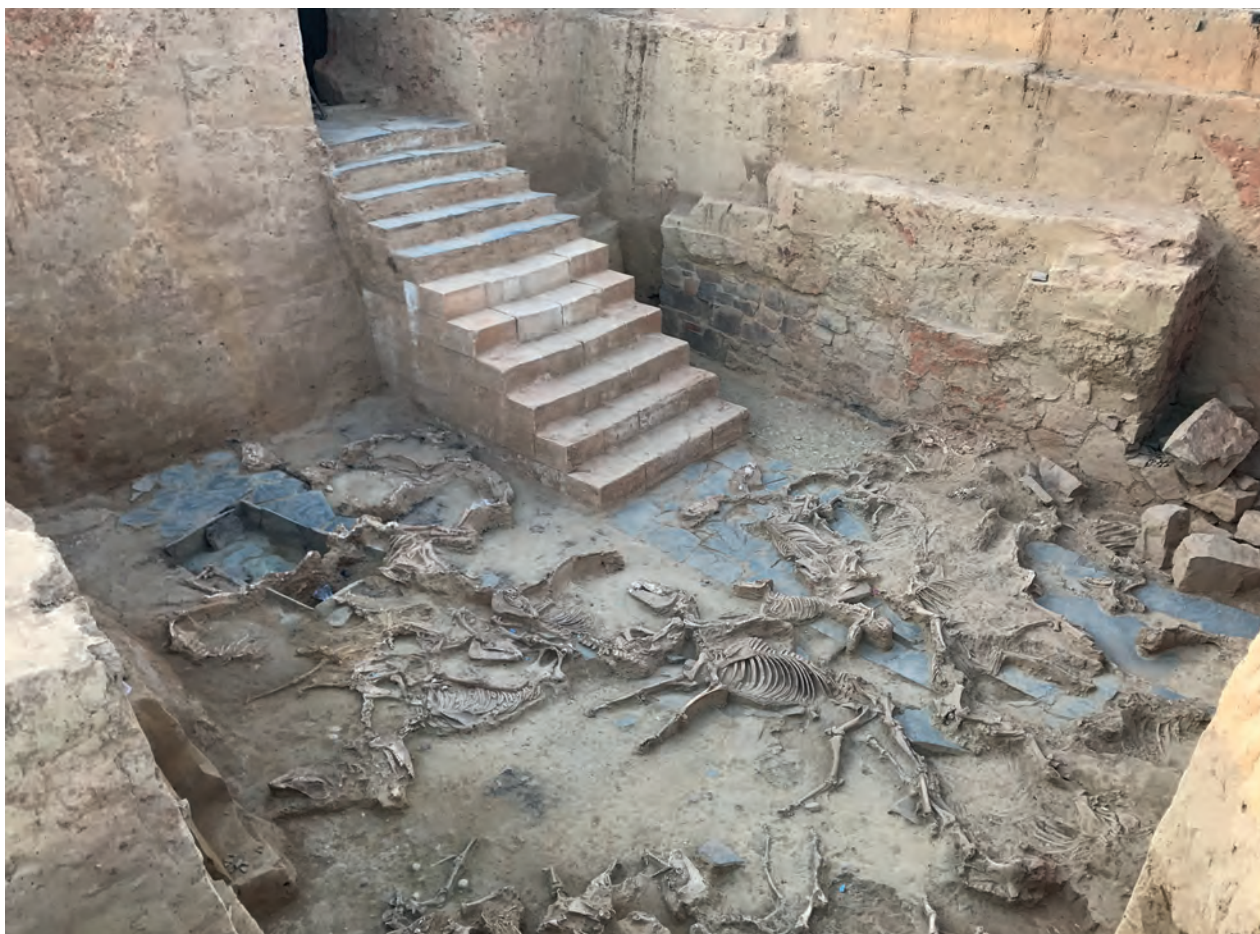
Fig. 1. Patio de El Turuñuelo.

Pero sin duda ha sido la figura de Juan Luis Arsuaga la que más expectación ha causado en todo el desarrollo del ciclo, poniendo de manifiesto el gran alcance de su labor divulgativa. No en vano el paleoantropólogo se ha convertido en una de las figuras más mediáticas de la actual investigación arqueológica en nuestro país, y ha conseguido despertar el interés por las teorías evolutivas entre el gran público, ayudando a difundir esta rama de conocimiento tan compleja y apasionante (fig. 2).