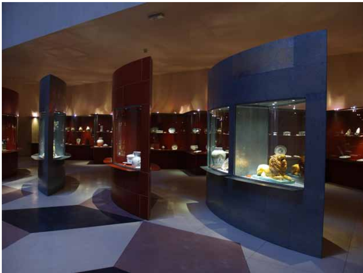
Fig. 4. Museo «Ruiz de Luna». Talavera. Convento de San Agustín. Segundo claustro.

de Ruiz de Luna, y una muestra de cerámica moderna de algunos descendientes de Ruiz de Luna.