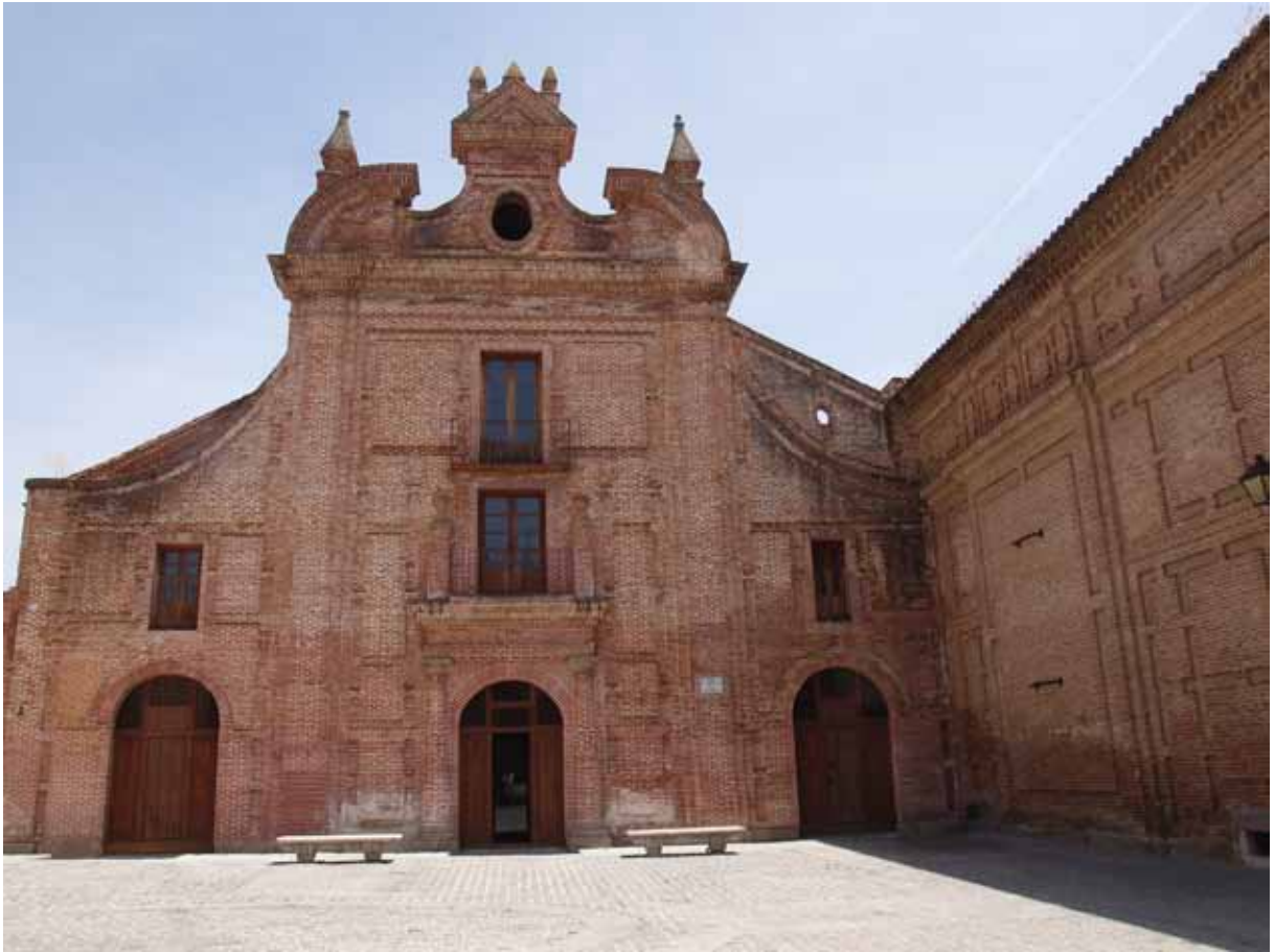
Fig. 2. Museo «Ruiz de Luna». Talavera. Iglesia y convento de San Agustín.