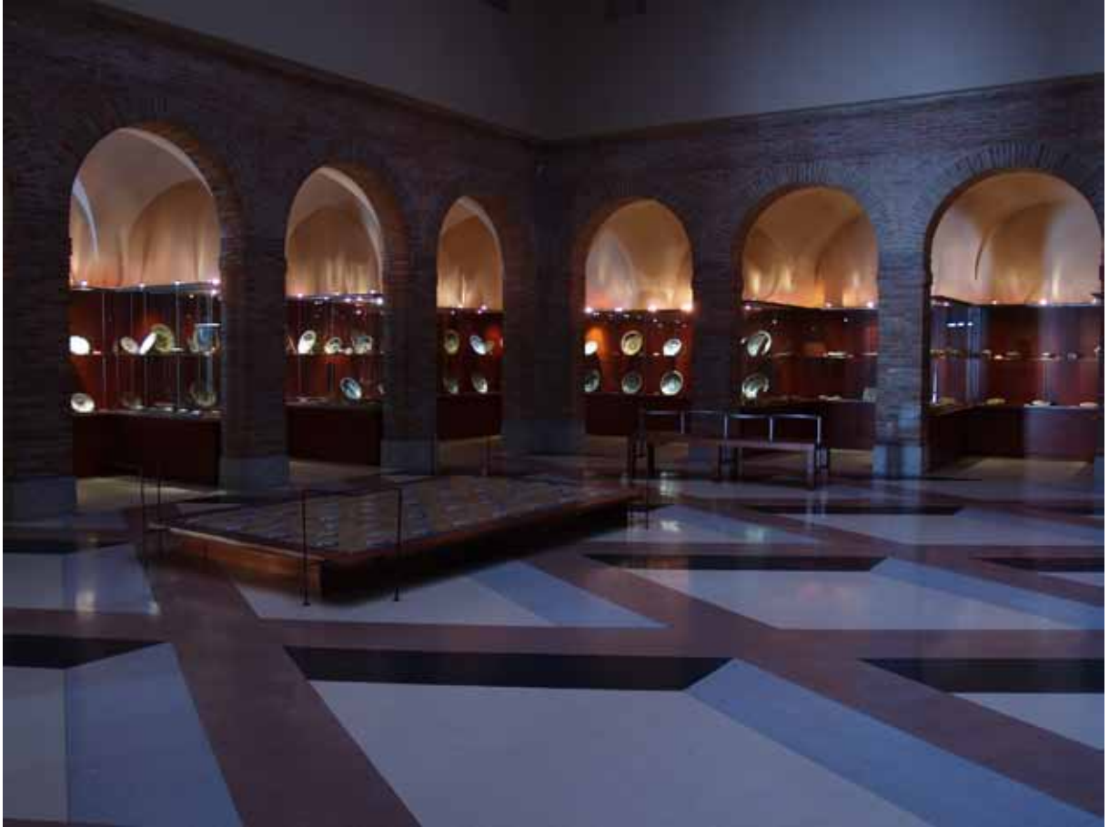
Fig. 3. Museo «Ruiz de Luna». Talavera. Convento de San Agustín. Primer claustro.

El Museo lo articularon en cuatro niveles: planta sótano donde están los almacenes; planta baja, donde están la recepción, el muelle y la exposición permanente distribuida en torno a los claustros; planta primera donde están el salón de actos, la sala de exposiciones temporales y los almacenes visitables, con las piezas ordenadas por series en armarios que funcionan como vitrinas; en la planta segunda están la biblioteca, el laboratorio de restauración, las oficinas y la sede de los Amigos del Museo, fundada en 1994, antes que el Museo estuviese abierto.