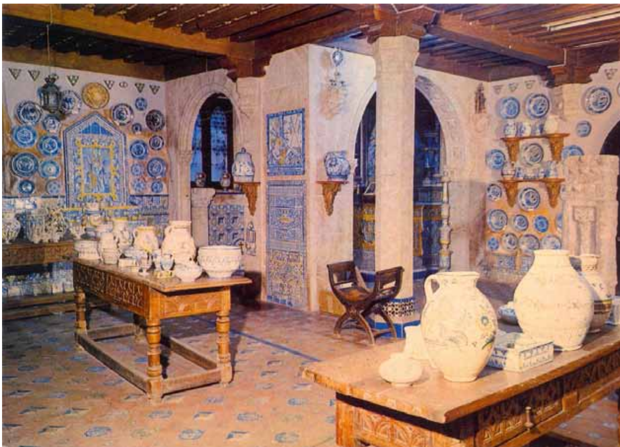
Fig. 1. Interior del Museo «Ruiz de Luna» de Talavera cuando estaba en la plaza del Pan (Postales MRL 1970 F.I.T.E.R. San Hilario Sacalm. Girona).

tierra en Museo y pasara del «cuarto de trastos» a cuatro salas unidas, con fachada a la plaza del Pan, con el nombre de Museo Ruiz de Luna. Cerámica Antigua de Talavera (siglos xv al xix).