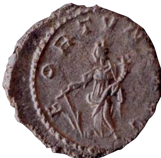
Fig. 11. Moneda de Póstumo con Fortuna en el anverso, Foto: CERES. Museo Nacional de Arte Romano de Mérida.

tesorillo de denarios romanos de Castrillo de Cabrera (León) (Mangas, y Blánquez, 1988: 92, n.º 19), o Póstumo del Museo de Arte Romano de Mérida (n.º inv. 36940) (fig. 11). En pintura mural romana se constata la representación de Venus-Fortuna en la Plaza de Cisneros de Valentia (Valencia) (Ribera et alii , 2007: 145), y de Fortuna en el municipium Augusta Bilbilis (Calatayud) (Martin-Bueno, 1975-76: 169-170 y 1991: 172-173). Esta última pertenece a un larario en la llamada Domus de la Fortuna, situada en el cerro de San Paterno, en el barranco de los sillares, fechada en época imperial.