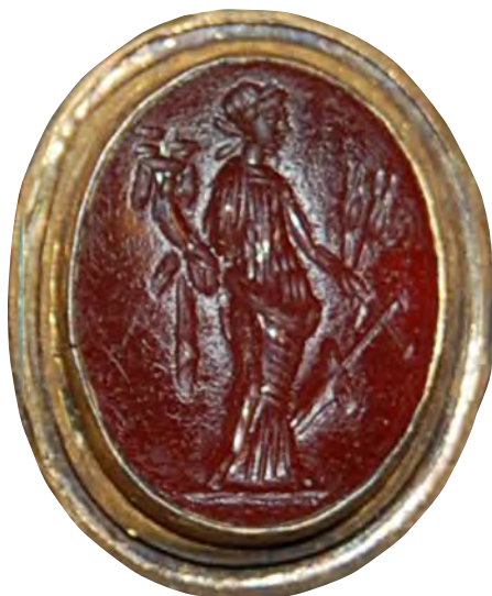
Fig. 9. Entalle sobre sardónice del British Museum (n.º inventario 1923,0401.211).