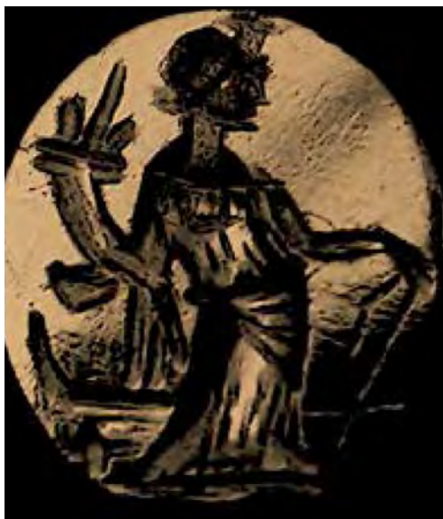
Fig. 7. Entalle del Castro de Cavalhelhos Portugal (según Pombo, 2017: 193 n.º 24).