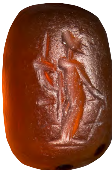
Fig. 8. Entalle sobre cornalina del Museo de Bellas Artes de Boston (n.º inv. 87.697).