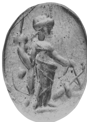
Fig. 10. Entalle de La Clínica (Calahorra) blanco/negro.

de Carvalhelhos (fig. 7) muestra un tipo de timón distinto, ya que se prolonga por detrás de la línea de suelo, detalle que, según la autora de la publicación, indica una datación anterior a época de Vespasiano (Pombo, 2014: 232, n.º 102, lám. IX). El mismo tipo de timón y con una cronología similar presenta el entalle del Museo Arqueológico Nacional de Lisboa (Pombo, 2017: 193, n.º 24).