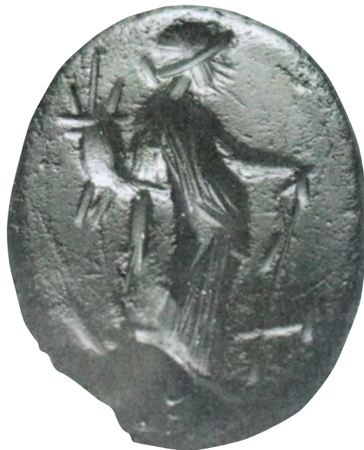
Fig. 6. Entalle de Asturica Augusta (Astorga) (según Casal, 2002: 28-29).

Los paralelos son abundantes, ya que el motivo es bastante popular y muy difundido en el mundo romano a partir de época augústea, aunque ya se constata en entalles desde época helenística, como por ejemplo en la colección del J. Paul Getty Museum (n.º inv. 92.AM.8.9). Realizado en cornalina sobre anillo de oro, procede de Alejandría (Egipto), presentando la personificación de la buena suerte apoyada sobre una columna (fig. 5). El peinado carece de tocado, y se adorna con un moño. La cronología de este anillo se sitúa entre el 220 y 100 a. C. (Spier, 1992: 121, n.º 315).