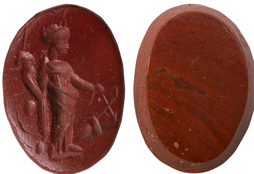
Fig. 4. Entalle de La Clínica. A. Cara anterior. B. Cara posterior.

El ejemplar se encuentra realizado en jaspe ( lapidis jaspidis ), la variedad granular del cuarzo más importante empleada en la glíptica romana (Alfaro, 1996: 20-21). Es de color rojo opaco y brillo mate. Presenta forma ovalada, con las caras planas y con los bordes inclinados hacia el reverso. Sus dimensiones son: longitud 11,2 mm, anchura 8,3 mm y espesor 2,5 mm. En su cara principal, sobre una línea del horizonte, presenta a la diosa Fortuna con sus atributos iconográficos. Fortuna se representa de pie y con un ligero tres cuartos hacia la izquierda, en la cabeza lleva un tocado o gorro en forma de torre, el peso del cuerpo recae sobre la pierna izquierda mientras que la derecha aparece ligeramente flexionada. Viste chiton e himation ceñido a la cintura, se aprecian con detalle los pliegues de la indumentaria y el escote en forma de V. Lleva como atributos la cornucopia, o cuerno de la abundancia, en el lado izquierdo y el timón o gubernaculum , que gobierna los destinos de los hombres, en la mano derecha. El estado de conservación es bueno, conservándose la pieza completa aunque presenta algunos rayados. Fortuna, hija de Júpiter –como indica la inscripción de Praeneste (Palestrina, Roma)– (Vázquez, 2005: 45) representa la personificación de la buena suerte y de la abundancia, aunque también está relacionada con la fecundidad. La presencia de la cornucopia acompañada del timón está relacionada con la prosperidad y la bonanza (Tamma, 1991: 35).