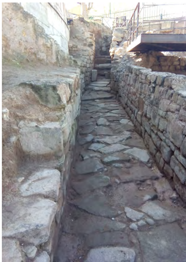
Fig. 2. Colector del yacimiento de La Clínica (Calahorra).

En el año 2017 el Ayuntamiento de Calahorra encarga una nueva limpieza del yacimiento