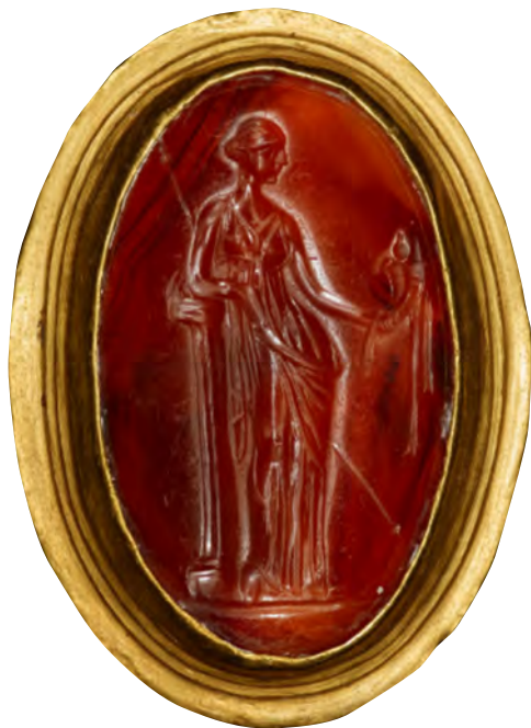
Fig. 5. Entalle del Museo J. Paul Getty (n.º inv. 92.AM.8.9). Cornalina sobre anillo de oro.