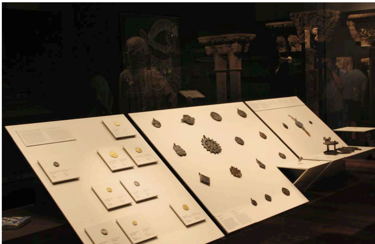
Fig. 8. Detalle de los pliegues y cartelas-bandeja en los soportes (sala 27).

sistemas allí utilizados y que habían demostrado su eficacia, y para cuya descripción detallada remitimos al artículo de Paula Grañeda: soportes modulados con planos inclinados y repisas, que permitieran disponer tanto monedas individuales en la mejor colocación para recibir la luz, como tesoros amontonados y objetos no planos, con sistemas de sujeción lo menos invasivos posible. Como en el área monográfica, en todo momento se ha buscado una disposición que resultara ágil y atractiva, tratando cada módulo de forma independiente según la idea a transmitir y el contenido a exponer, creando distintos planos mediante las cartelas que sirven de soporte directo a las piezas y sus textos –las llamadas «cartelas-bandeja»–, y mediante la propia colocación de las monedas. Para ello cada vitrina y cada módulo se diseñaron previamente en una fase de premontaje en la que se comprobó, a escala 1:1 y con las piezas reales, cuál era la disposición adecuada para el espacio disponible y la correcta comprensión del mensaje. La selección de las piezas fue muy medida y reducida a lo imprescindible, teniendo en cuenta tanto que el espacio disponible era limitado como que, pequeñas como son, debían resultar visibles en el conjunto de la vitrina.