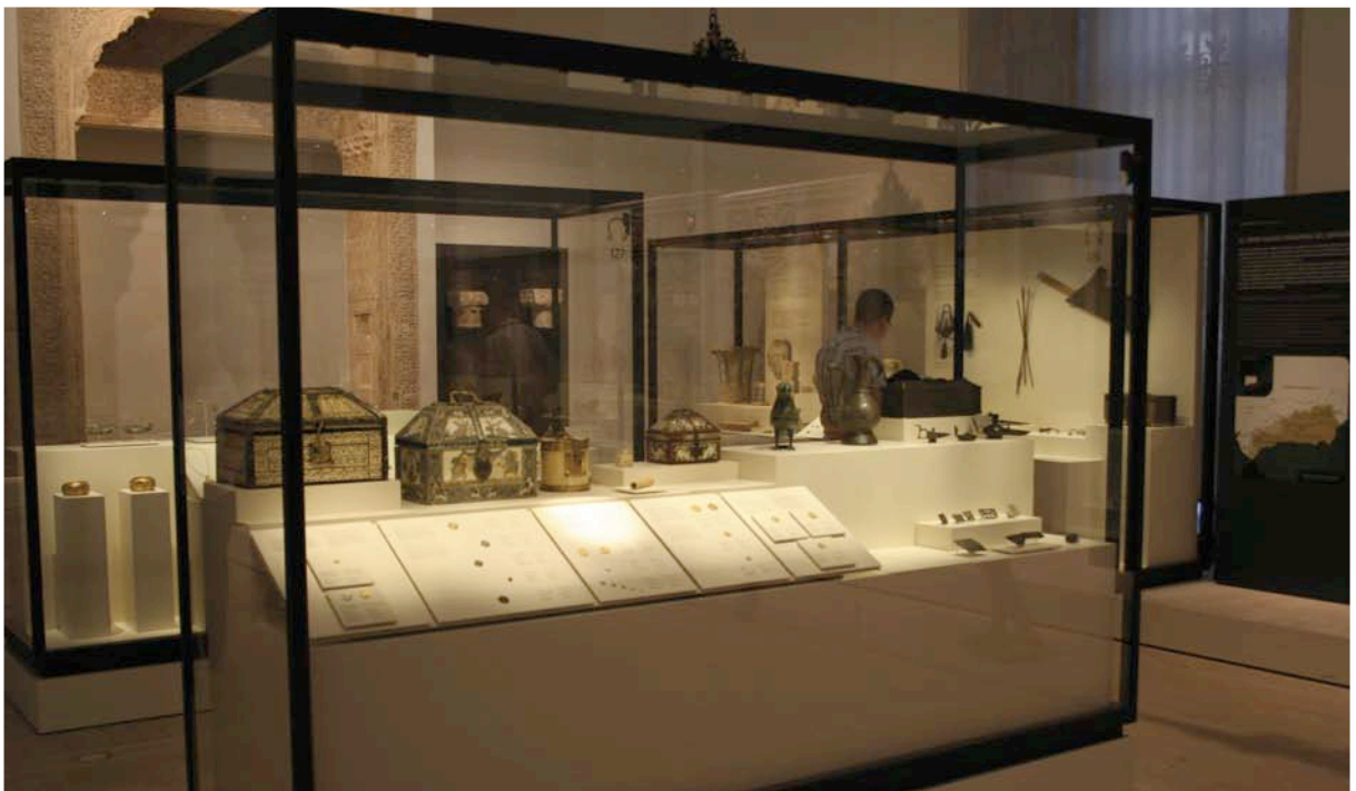
Fig. 7. La trayectoria política de al-Ándalus en los siglos XII-XIII, en la sala 23.

Con la experiencia adquirida en el montaje de La moneda, algo más que dinero , la disposición de las piezas numismáticas en el discurso general ha intentado replicar los