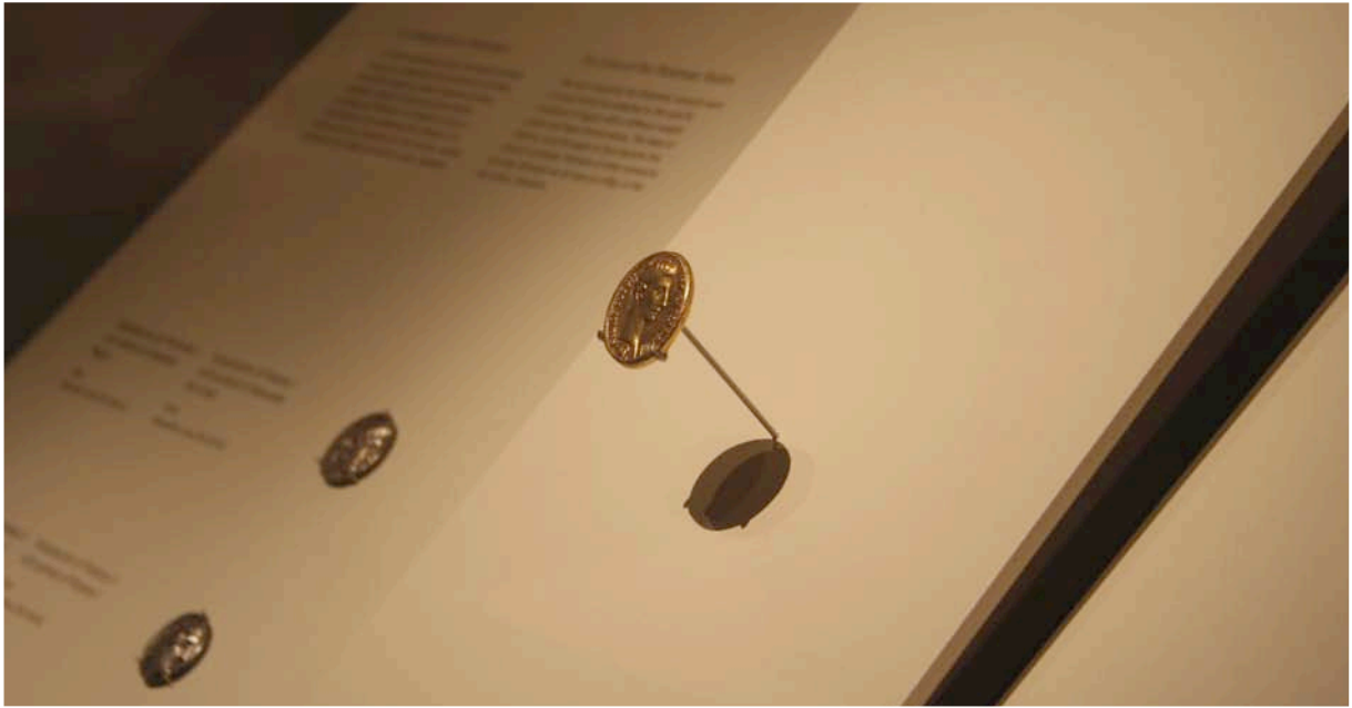
Fig. 9. Pliegue y anclaje especial para el cuaternión de Augusto (sala 33).

Las «piezas destacadas» planteaban un problema concreto: por su tamaño no suelen resaltar en el conjunto, mientras que el formato de cartela diseñado para estos objetos –mayor tamaño y cuerpo de letra– no siempre daba el resultado deseado. En La moneda, algo más que dinero , este problema se resolvió utilizando un color distinto que permitía ubicar rápidamente los objetos y facilitaba el recorrido por las piezas esenciales. Como no era posible trasladar esta solución, hubo que jugar con los volúmenes, resaltando la pieza con una cartela-bandeja, doblando el propio soporte o creando anclajes especiales. Éste último recurso se utilizó con el cuaternión de Augusto, con la gran dobla de Pedro I de Castilla y con la pieza de ocho áureos de Claudio II.