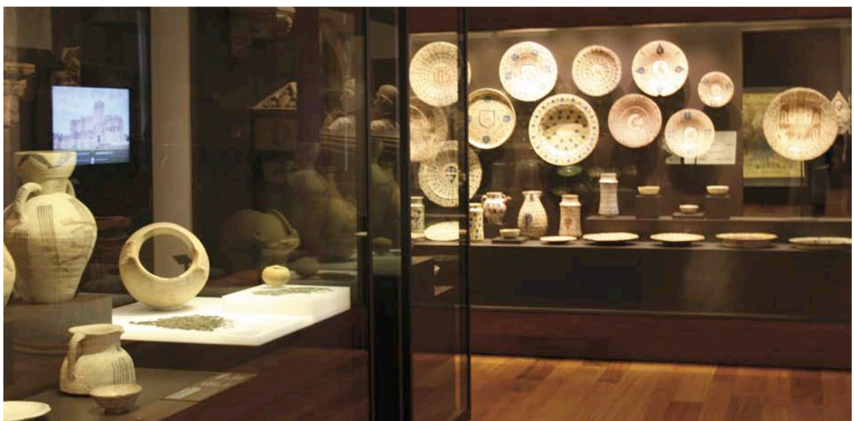
Fig. 3. Los tesoros de Castrojeriz y Palacio de la Galiana, en la sala 27.

Precisamente por esta razón se reflexionó mucho sobre cuál era el mejor lugar para exponer las grandes piezas de la colección, las más conocidas, algunas de ellas únicas: