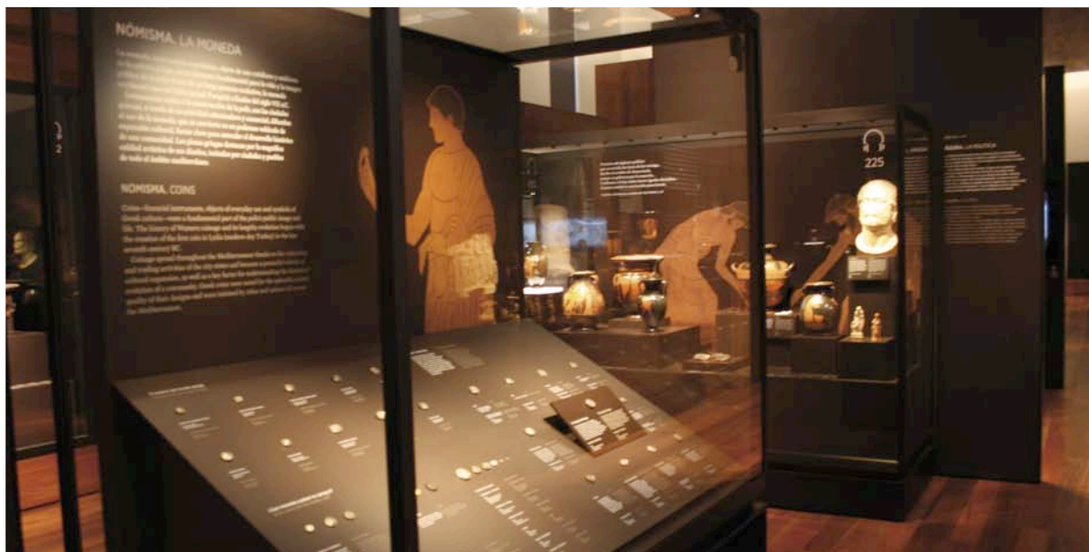
Fig. 2. Nomisma, la vitrina dedicada a las monedas de los griegos, en la sala 36. Se aprecia el soporte «doblado» de la pieza destacada.

Al encarar el nuevo programa expositivo se tuvo muy en cuenta el recuerdo del espacio fundamental que ocupó el Salón de Numismática durante décadas, pero también las experiencias de los últimos años, concebidas como auténticos bancos de pruebas en espera de la oportunidad de una exhibición adecuada. Con este objetivo en mente, tanto las integraciones parciales en la antigua exposición permanente como las muestras temporales sirvieron para afirmarnos en la necesidad de la solución que hemos dado en llamar «el doble recorrido», así como para observar la respuesta del público ante las piezas numismáticas, su presentación visual, la información que las acompañaba y de qué modo podían aprovecharse las múltiples interpretaciones e «historias» que suscitan.