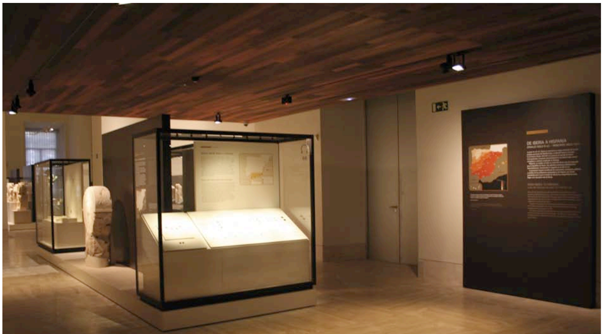
Fig. 5. La vitrina dedicada a la Segunda Guerra Púnica, encabezando la sala 17.

Citando algunos ejemplos: las dificultades para explicar la presencia cartaginesa y sus consecuencias, inicio de una nueva etapa para la Península, se soslayaron narrando la Segunda Guerra Púnica a través del dinero que utilizaron sus ejércitos en el choque bélico, dando la ocasión tanto de mostrar los impresionantes múltiples cartagineses acuñados en Iberia como la creación del sistema del denario romano, fundamental para la historia posterior de Hispania. En el otro extremo de la línea temporal, la Guerra de Sucesión que llevó al trono al primer Borbón, Felipe V, se ilustra a través de las medallas que los contendientes utilizaron en sus sistemas de propaganda.