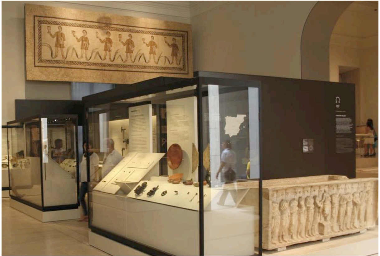
Fig. 1. El módulo dedicado a las acuñaciones del Bajo Imperio («Crisis, riqueza y moneda»), en la sala 33.

Desde los primeros planteamientos de un nuevo programa museográfico y arquitectónico para el MAN, hace casi ya una década, se asumió la necesidad de corregir una situación que, no por haberse prolongado durante medio siglo, resultaba menos extraña a los ojos del visitante y del investigador: la ausencia de la importante colección numismática del Museo en la exposición permanente desde 1951. Esta anomalía, de la que el Departamento de Numismática y Medallística fue siempre consciente, fue subsanada desde finales de la década de los 80, en la medida de lo posible dadas las carencias espaciales y económicas, gracias a la sala Tesoros del Gabinete Numismático , al montaje de exposiciones temporales y a la integración paulatina en el recorrido general del Museo de vitrinas con monedas representativas de cada cultura, así como de vitrinas «invitadas» con temas o piezas numismáticas. Sin embargo, faltaba una auténtica integración de las colecciones en el discurso del Museo.