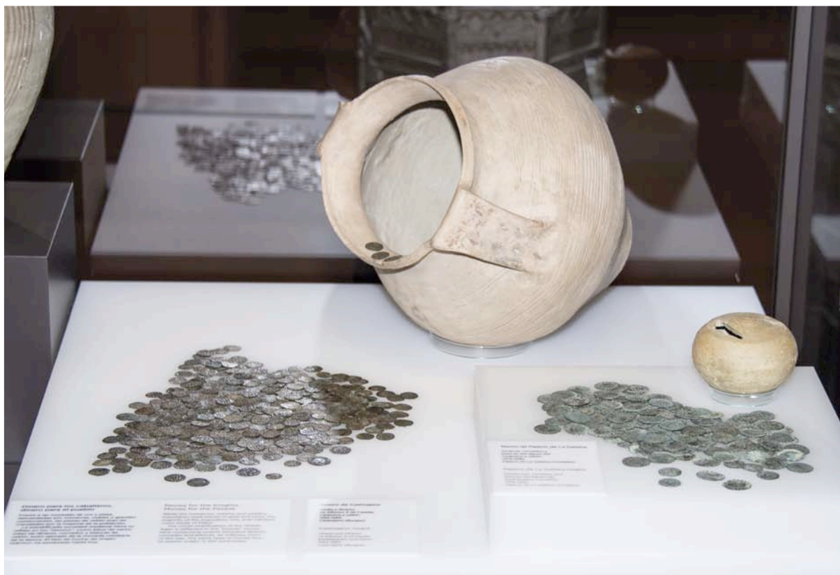
Fig. 4. Detalle de los tesoros de Castrojeriz y Palacio de la Galiana.

Como parte de la cultura material y como creación humana esencial en el devenir político, económico y social, era evidente que el dinero de cada época debía estar presente en los espacios correspondientes a cada cultura o período histórico. Sin embargo, no sólo se muestran los sistemas monetarios; en colaboración con los técnicos del resto de Departamentos y calibrando las necesidades del discurso y las posibilidades de la colección, las monedas se han utilizado para ilustrar aspectos sociales, bélicos, identitarios y económicos, aprovechando las capacidades de las monedas para narrar tanto la historia oficial como la peripecia cotidiana.