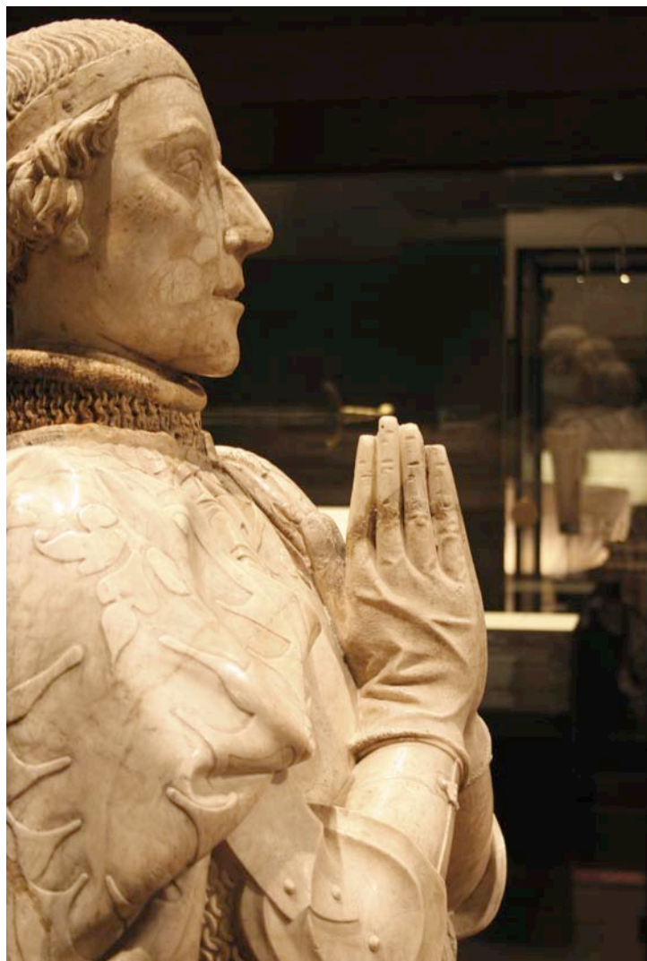
Fig. 10. La estatua orante de Pedro I de Castilla, al fondo, la Gran Dobra, acuñada por este monarca (sala 27).

A pesar de estos problemas, que ya trabajamos para solucionar, la integración de las colecciones numismáticas en el discurso histórico de las salas del Museo ha sido un proceso complejo pero gratificante, en el que el trabajo en equipo ha jugado un papel fundamental para conseguir un encaje satisfactorio de las piezas, tanto a nivel conceptual como en el más plano más físico, a nivel de vitrina, devolviéndolas al lugar que les corresponde como parte de la cultura material y como instrumentos fundamentales para la reconstrucción –y la construcción– de la Historia. Sin embargo, será la experiencia del público recorriendo las salas y deteniéndose en estos objetos, tan pequeños pero elocuentes, la que proporcione el mejor indicador para calibrar el éxito del montaje y los proyectos para el futuro.