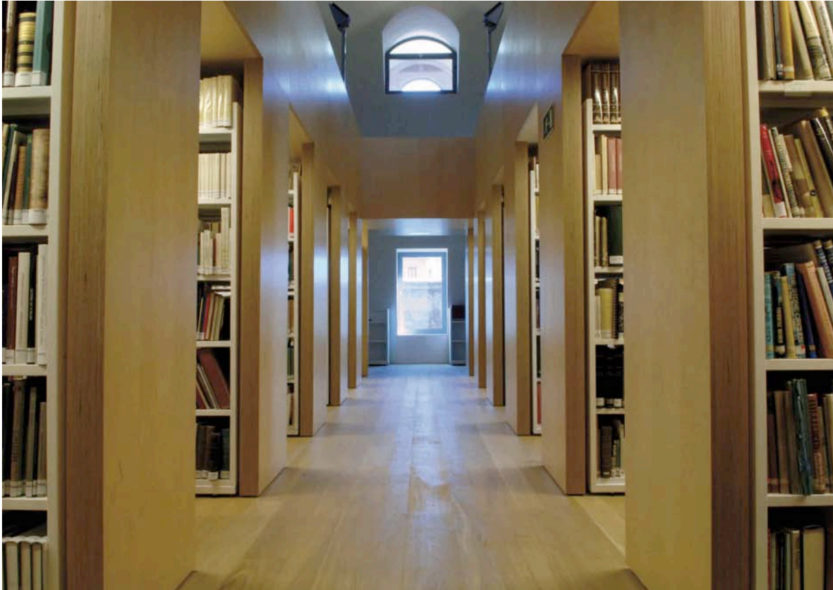
Fig. 4. Vista del depósito en el Torreón.