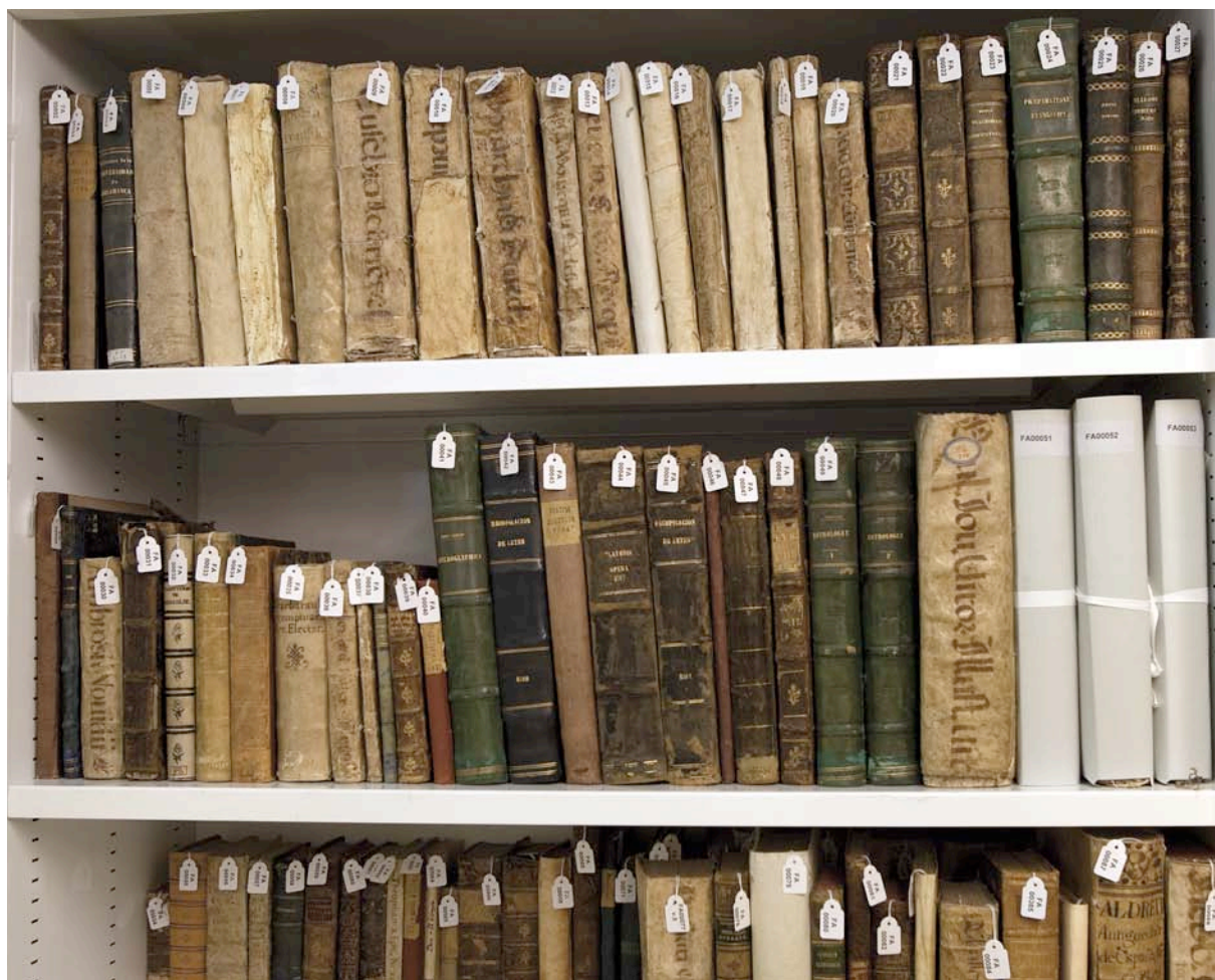
Fig. 6. Estanterías en Fondo Antiguo.

Son datos provisionales ya que el fondo antiguo continúa revisándose y es frecuente encontrar títulos que no han sido catalogados e incorporados al catálogo (Figura 6). Esta revisión también determinará el volumen final de manuscritos. Por otro lado, está prevista la catalogación de diecisiete cajas de separatas que aumentarán sensiblemente el número de ejemplares de monografías.