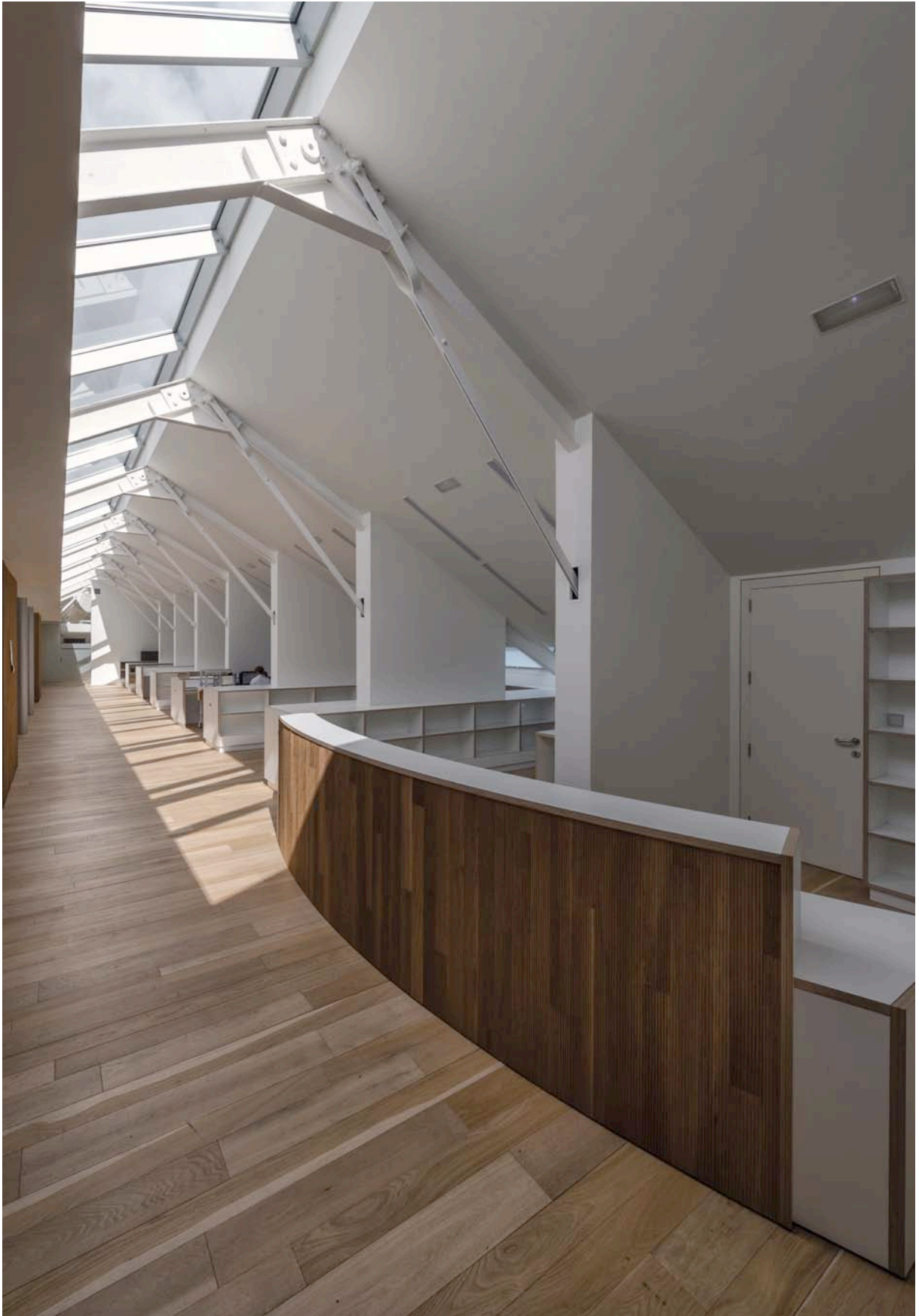
Fig. 2. Vista del punto de información de la Biblioteca.