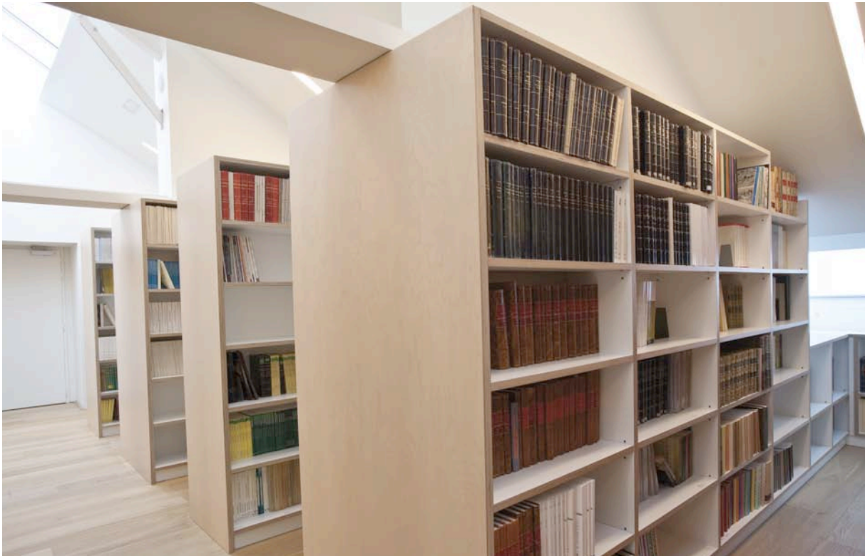
Fig. 3. Vista parcial del depósito en cerchas.