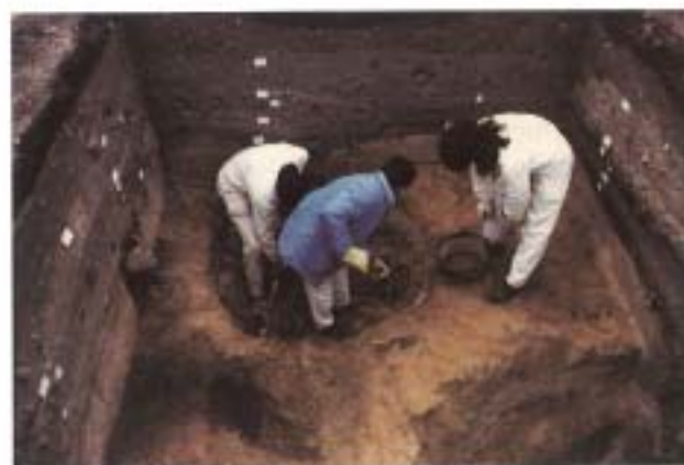
3. Excavación de Tierra de Las Monedas III, durante el vaciado de las fosas/basurero.