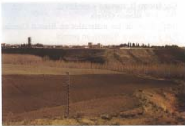
2. Coca desde el castro Cuesta del Mercado. En primer término, Tierras de Las Pizarras. Al fondo, espigón de Los Azafranales.