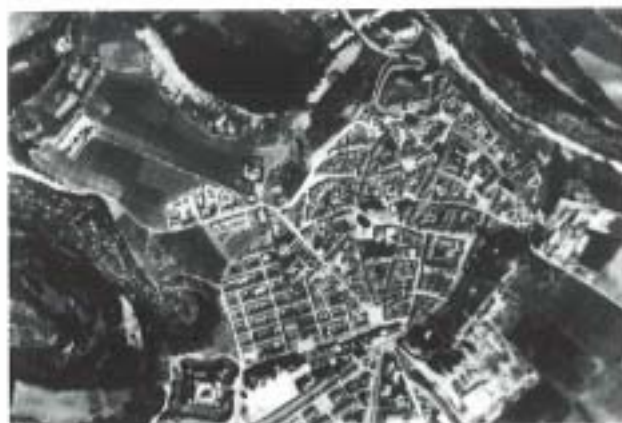
1. Casco urbano y espigón de Los Azafranales.