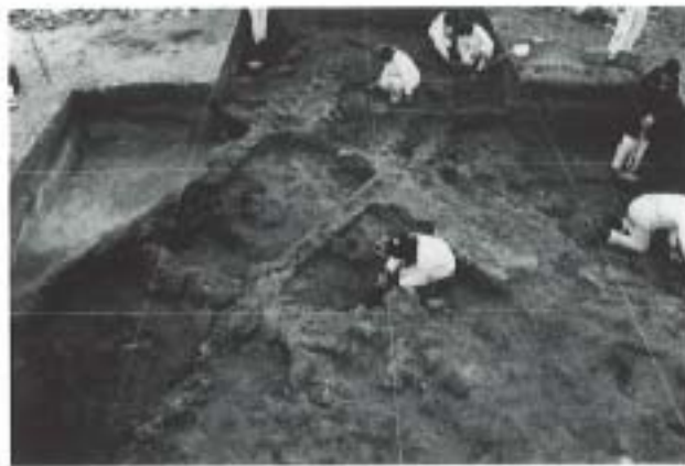
4. Excavación de Tierra de Las Monedas IV (instalaciones alfareras vacceas de mediados del siglo III a. C.).

Bibl.: Parte de los materiales en Blanco García, 1993a; Blanco y Juan, en prensa; Juan y Blanco, en prensa.