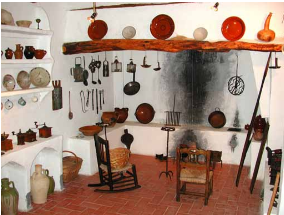
Fig. 3. Elementos de una cocina típica de una masía de la zona del interior de la provincia de Castellón.