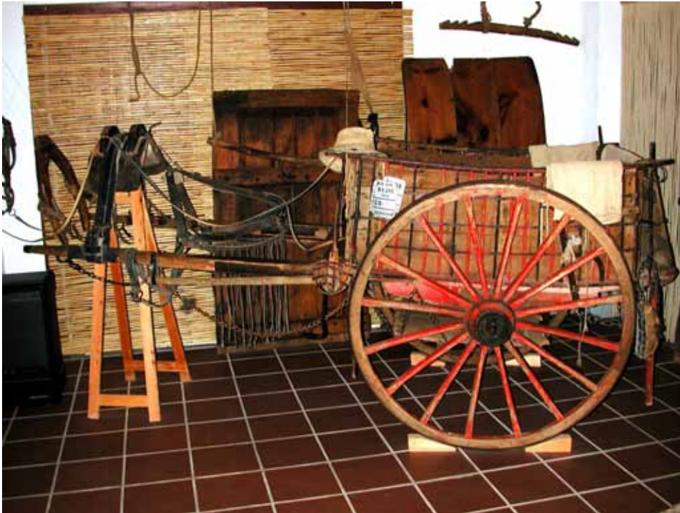
Fig. 2. Carro y diferentes aperos utilizados antiguamente con animales.