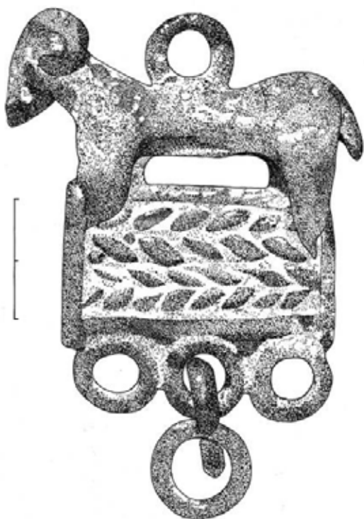
Fig. 2. Colgante de bronce de época ibérica procedente de Torre Monfort (Benassal).

Las excavaciones de urgencia practicadas en 1970 en el Castell d'Asens de Benassal, proporcionaron la planta de un departamento cuadrangular de una de las viviendas del poblado, pavimentado con losas que descansaban sobre pequeños muretes, obteniendo un refinado sistema de aislamiento de la humedad. El material recuperado se halla expuesto en la vitrina correspondiente y se data en el siglo II a. C. El mundo ibérico conoce desde el principio un tipo de escritura cuyos signos derivan de alfabetos orientales y cuya lengua, aún no descifrada en su totalidad, muestra parecidos fonéticos con el actual euskera. Una muestra en Benassal de esta escritura ibérica es la lápida inscrita que se rescató hace años del Mas de Corbó. La moneda empieza a circular entre las poblaciones ibéricas: varias muestras han sido halladas en la contornada.