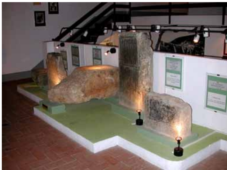
Fig. 4. Estelas funerarias recuperadas de una antigua villa romana.