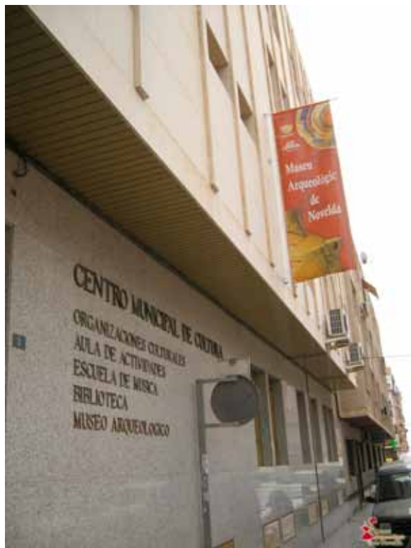
Fig. 2. Desde 1983, el Museo Histórico-Artístico de Novelda se localiza en la 2.ª planta de la Casa de Cultura.