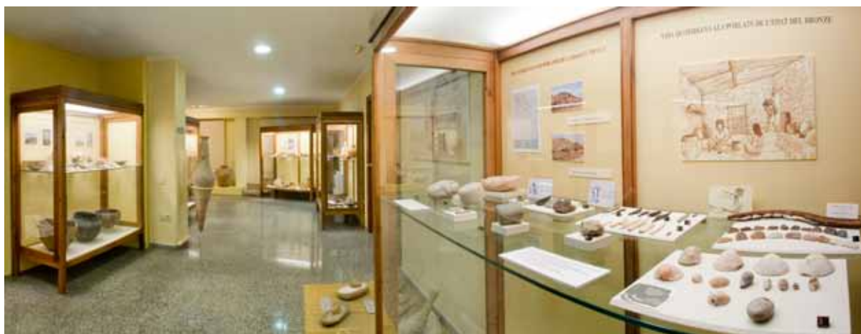
Fig. 3. Interior del Museo Arqueológico tras la ampliación y reforma del año 2003.

culturales, o jornadas especiales de puertas abiertas, tanto al propio Museo como a los distintos enclaves arqueológicos e históricos de la localidad. Actividades que semanalmente son publicitadas a través de nuestro propio blog, creado mediante WordPress ( https://noveldamuseoarqueologico.wordpress.com/ ), y redes sociales como Facebook ( https://www.facebook.com/museoarqueologiconovelda/ ), contando además con diversos recursos QR y pantalla de proyecciones en las salas expositivas del Museo.