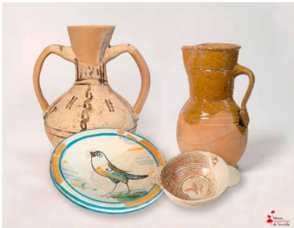
Fig. 5. Conjunto cerámico hallado en las excavaciones arqueológicas del casco urbano, con piezas fechadas entre los siglos XV-XVIII.

dose en la necrópolis de La Regalissia diversos ajuares funerarios expuestos en el Museo, con falcatas de hierro, terracotas, fíbulas de bronce, vasos cerámicos con figuras rojas de origen griego, etc., sin olvidar los ricos conjuntos cerámicos de uso doméstico, pintados con motivos geométricos, vegetales o zoomorfos.