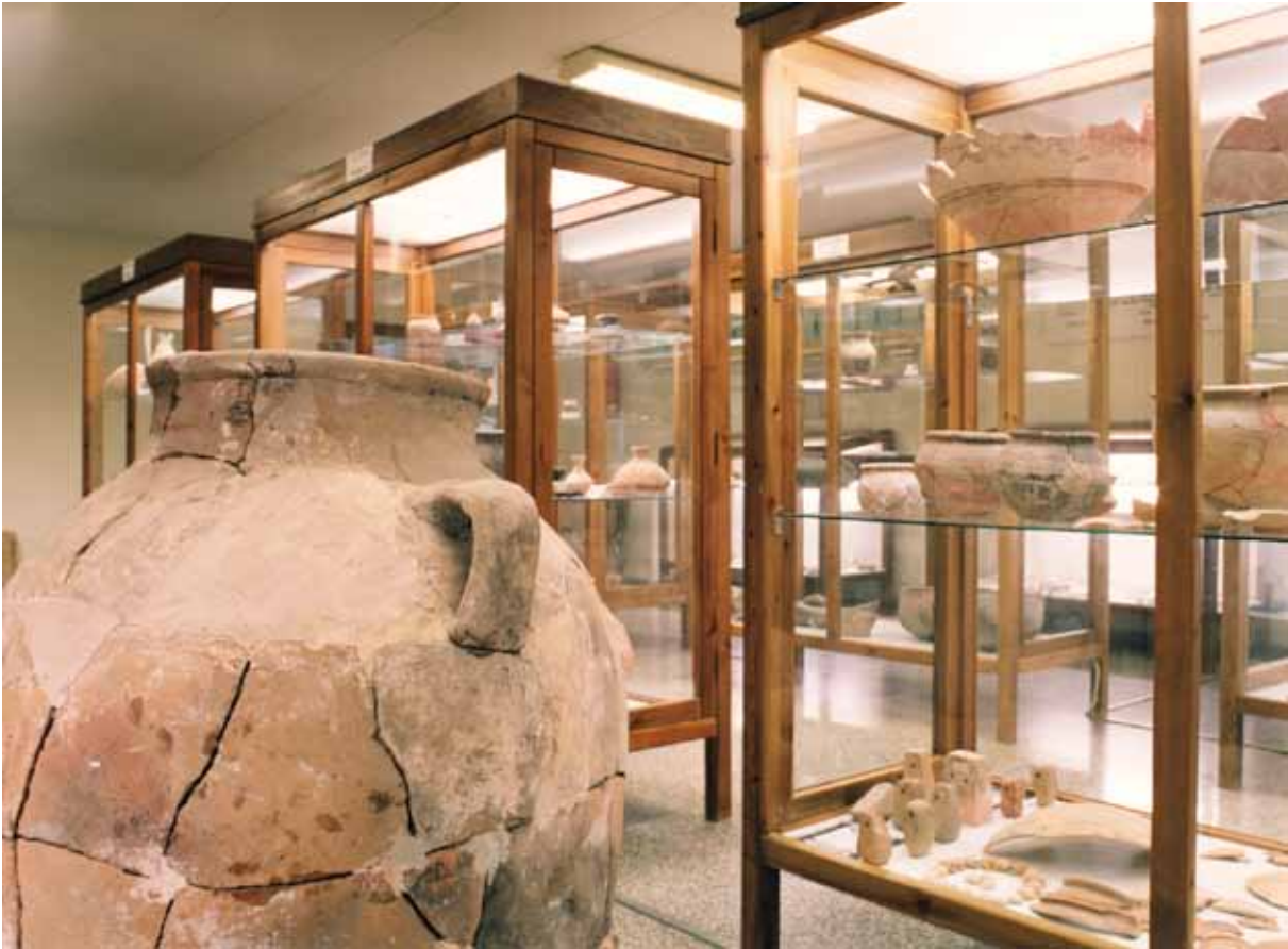
Fig. 1. Vista de la sala expositiva del Museo Arqueológico de Novelda en 1993.