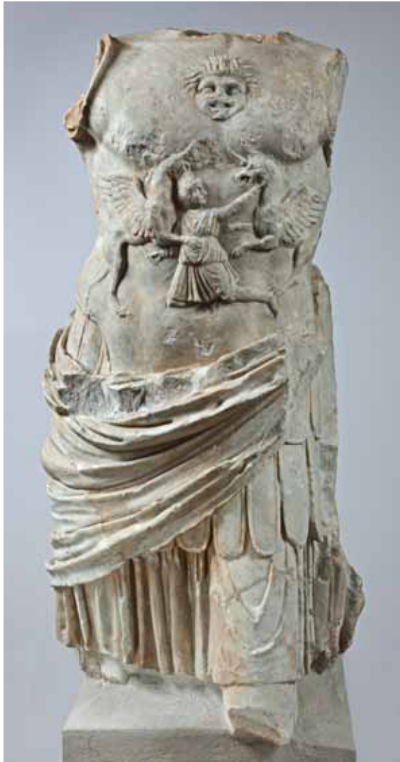
Fig. 1. Torso de escultura thoracata , primera mitad del siglo I d. C.

Ysasi realizaron la primera excavación oficial. Los más importantes objetos aparecidos entre los años 1925 y 1931 se asignaron al Museo Arqueológico Nacional.