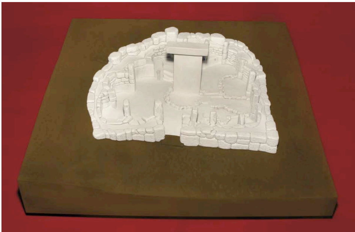
Fig. 4. Maqueta de la taula de Torralba d'en Salort (Menorca).

El primer paso era el análisis de la información científica y su elaboración. El equipo del Departamento de Protohistoria y Colonizaciones y los arqueólogos «insignia» de cada yacimiento aportaron la información científica disponible. A partir de la interpretación de esta documentación se elaboraron modelos virtuales en 3D de las geometrías básicas que tendrían las maquetas para facilitar la supervisión y las correcciones. Una vez que se aplicaban esas correcciones, se procedía a la fabricación física de la maqueta.