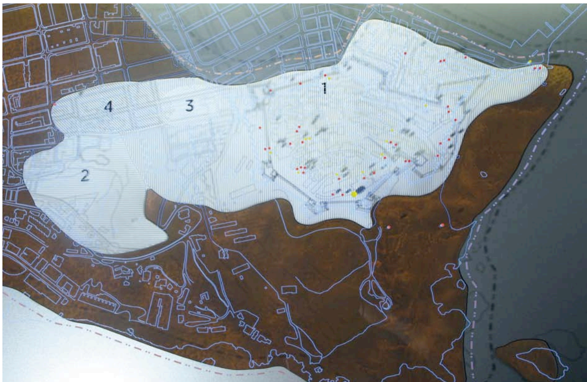
Fig. 3. Maqueta de Ebusus (Ibiza).

Así planteadas, las maquetas trascienden del objeto puramente contemplativo y de carácter escenográfico para convertirse en material de capacidad didáctica y evocadora. Se transforman en proposiciones tridimensionales de una evidencia arqueológica sobre la que un público más heterogéneo pueda reinterpretar el conocimiento aprendido. Se trata por tanto de conseguir objetos tridimensionales, rigurosos y veraces, en cuanto que su realización está basada en información científica, y que funcionen como propuestas didácticas abiertas en las que quepan discursos de diversa naturaleza y nivel. Diseñadas con criterios estéticos y plásticos más abstractos, menos ortodoxos, que permitan la generación de objetos que expongan la realidad de modo sugerente.