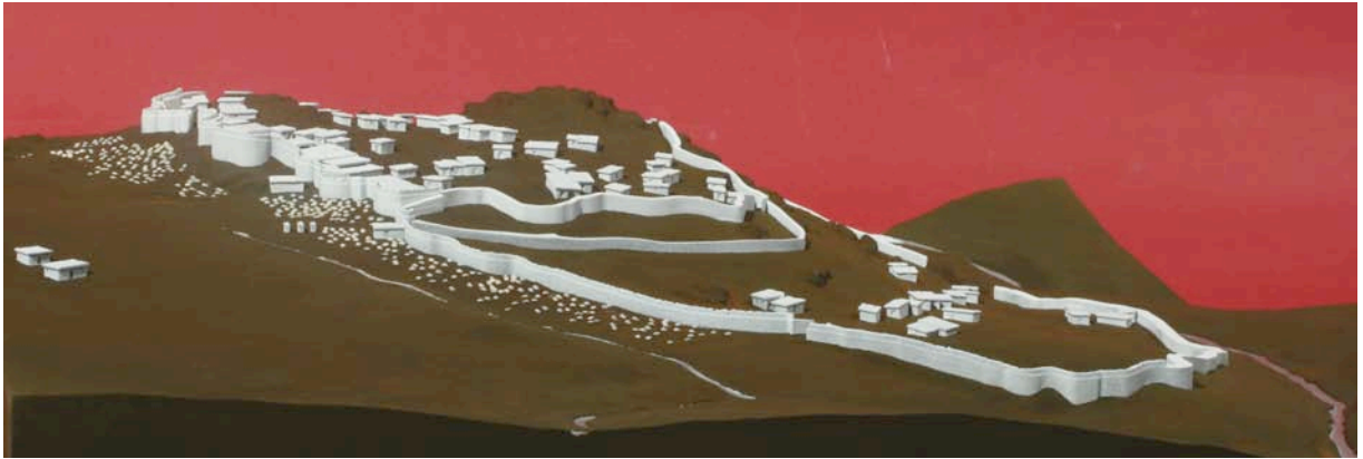
Fig. 5. Maqueta del castro de Las Cogotas (Cardeñosa, Ávila).

Para la realización de los elementos más delicados, de menores dimensiones y que requerían de un detalle de miniatura, como fueron los caseríos en las maquetas de Puente Tablas o Las Cogotas y alguna de las murallas se utilizaron técnicas de fabricación por adición de capas (fabricación aditiva), empleando principalmente en estos casos el sinterizado en poliamida.