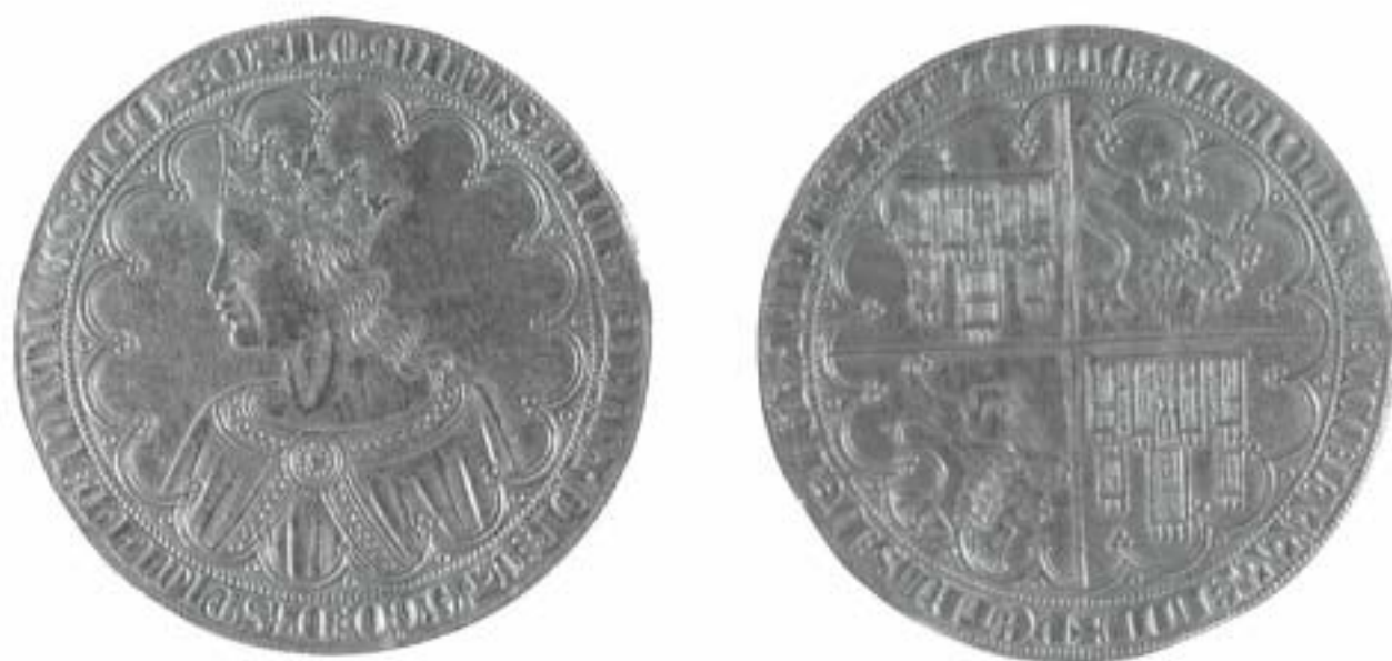
Fig. 1. Gran Dobra de Pedro I el Cruel. Museo Arqueológico Nacional. Inv. 1867/16/104.

samente parece que no llegó a emitir moneda propia en el transcurso de su reinado) viene de tiempos anteriores. En 1383 encontramos un documento donde Carlos II "el Malo", compra para su hijo primogénito "Charles", una dobla de diez doblas del rey don Pedro de Castilla (Archivo General de Navarra, Cajón. 47 nº 82.IX, de 14 de noviembre. Anexo I) adquirida a un mercader de Sangüesa llamado Pascual Gadain. El pago de dicha pieza se realiza el 15 de diciembre y probablemente -dadas las fechas- se trata de un obsequio navideño.