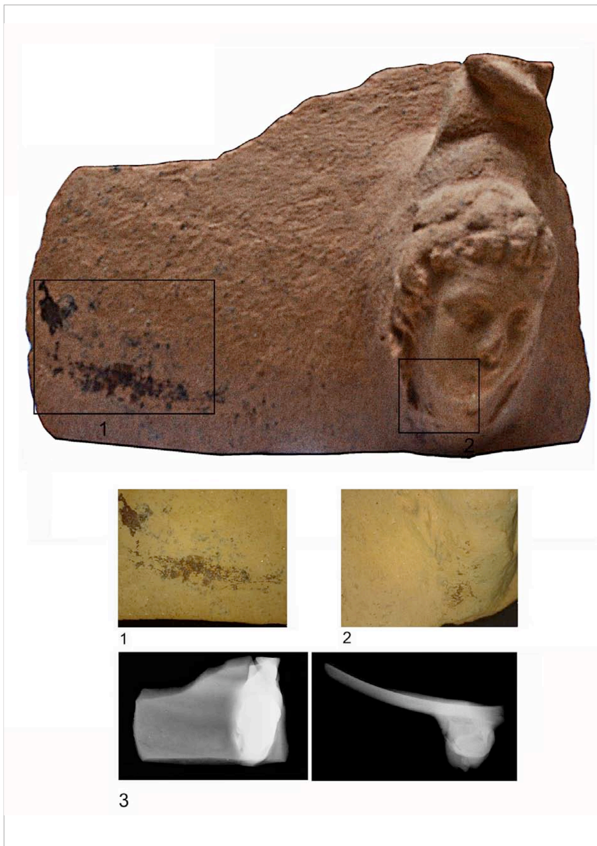
Fig. 2. Escaneado láser 3D de la pieza e imágenes con microscopio digital donde se aprecia una decoración pintada de color rojo en el cuerpo de la vasija y parte inferior de la cabeza, sin poder identificar el tema. En blanco y negro radiografía digital.