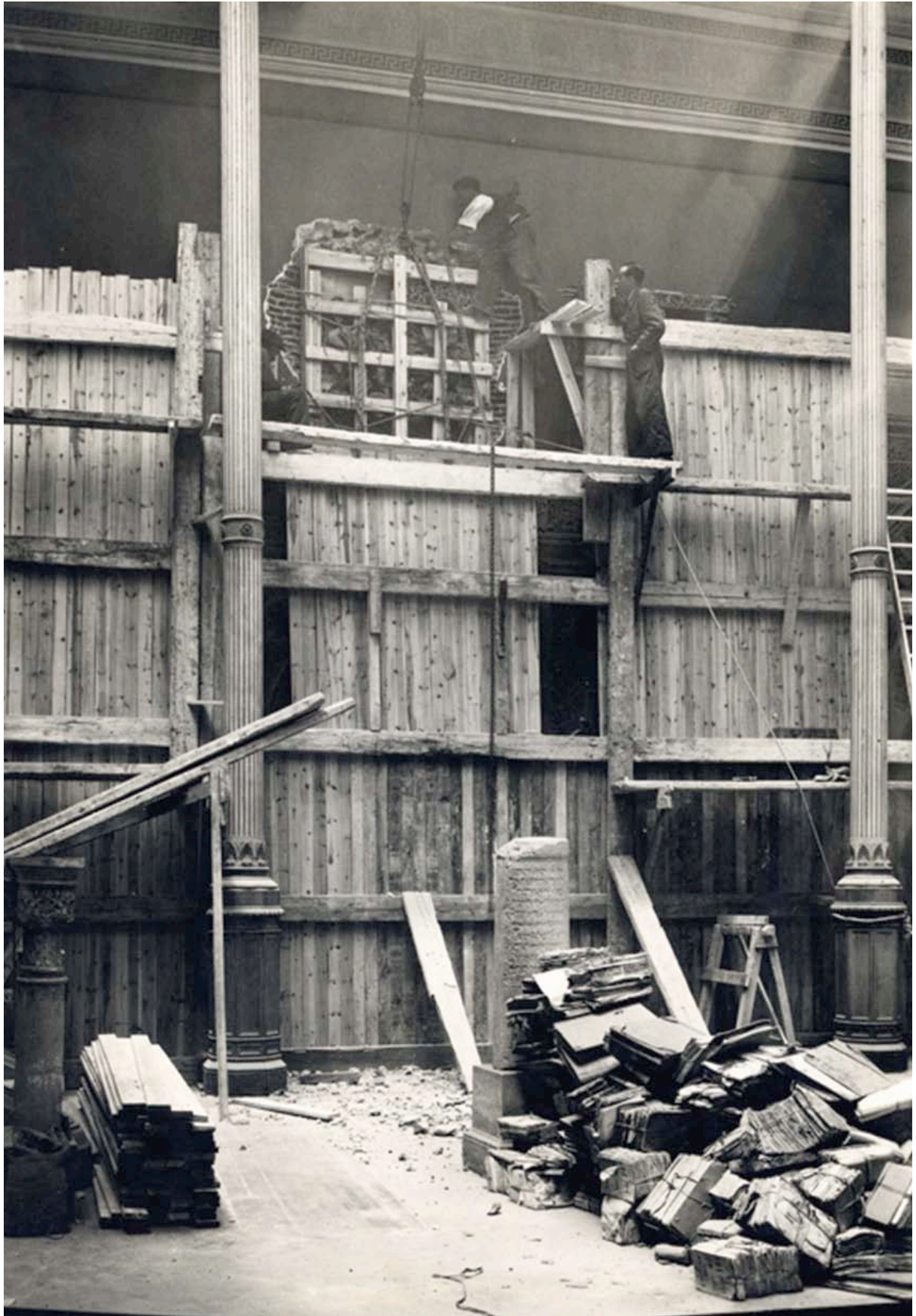
Fig. 8. Protección de los arcos del Patio Árabe durante la Guerra Civil.