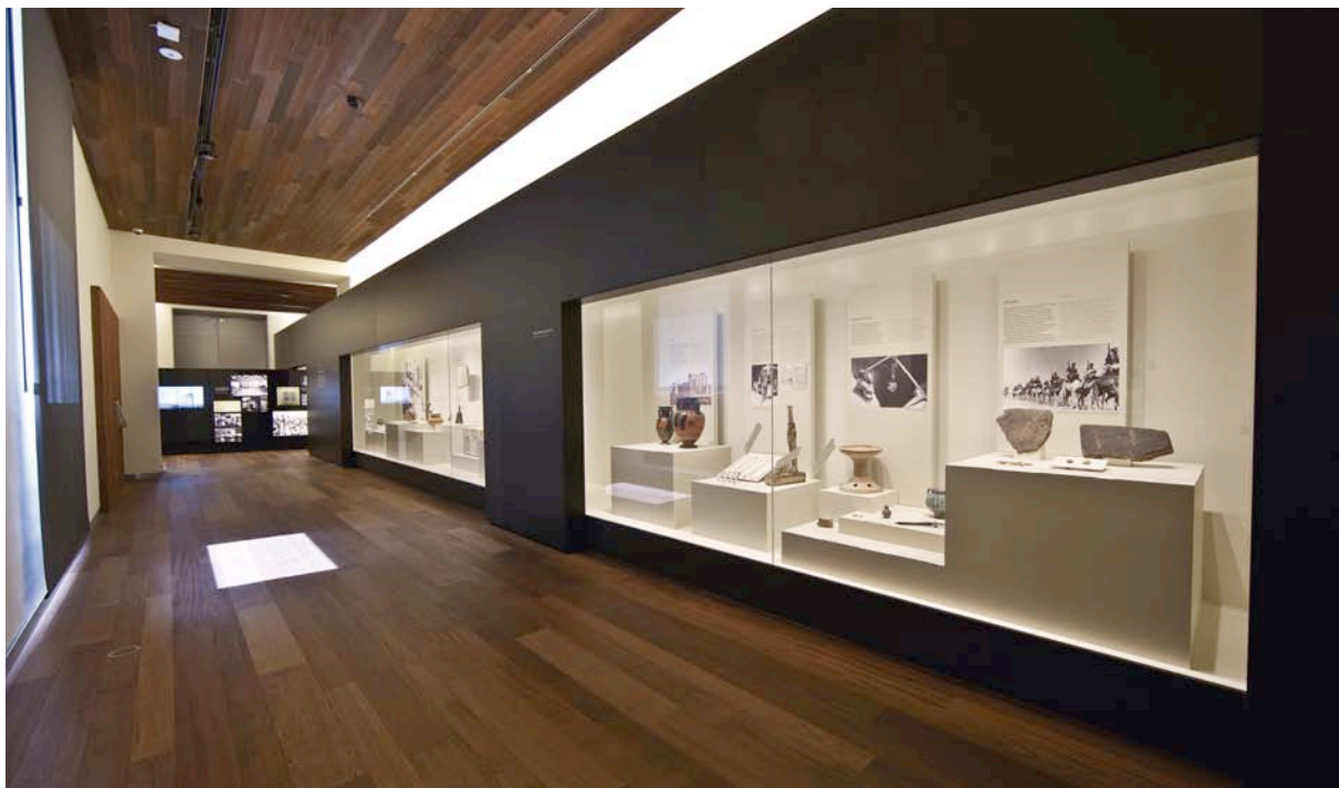
Fig. 9. Unidad temática «El camino hasta el Museo».

dirigida por José Luis López Linares, en la que se hace una recreación de lo sucedido la noche del 4 al 5 de noviembre de 1936 en el Monetario del Museo. En la ambientación pudimos utilizar los armarios reales que entonces albergaban las monedas y que hace ya muchos años que se utilizan como armarios para fondos antiguos de la Biblioteca en las Salas Nobles.