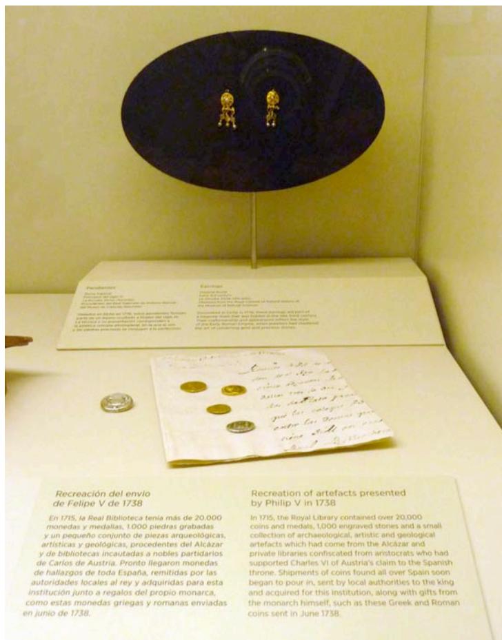
Fig. 5. Montaje en vitrina de piezas y documentación facsímil.

En esta subunidad proponemos unas etapas para observar la evolución y el cambio en la museografía de la institución: desde su creación hasta la Guerra Civil («De los primeros