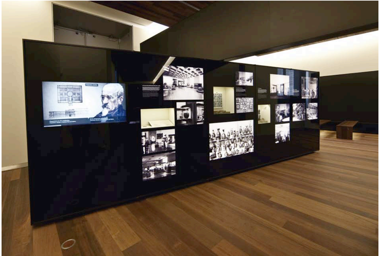
Fig. 4. Muro central.

al Museo, imágenes de las vitrinas en las que aparecen o de las láminas de los libros en las que se dieron a conocer... De este modo entre pieza y documento se ofrece una mirada global. Se ha optado, como es lo habitual en las exposiciones permanentes, por realizar facsímiles y no exponer los originales, pues si bien creando en las vitrinas las condiciones idóneas para la exposición de documentos en papel pueden exponerse éstos, son importantes los inconvenientes derivados de los necesarios cambios periódicos y los problemas que se generan de relación con el resto de la información o las piezas de la vitrina 12 . Los magníficos facsímiles que se han elaborado tras el contraste con los documentos originales, probando distintos papeles, texturas, tintas, acabados... hacen que, teniendo los dos en la mano, sea difícil distinguir copia y original.