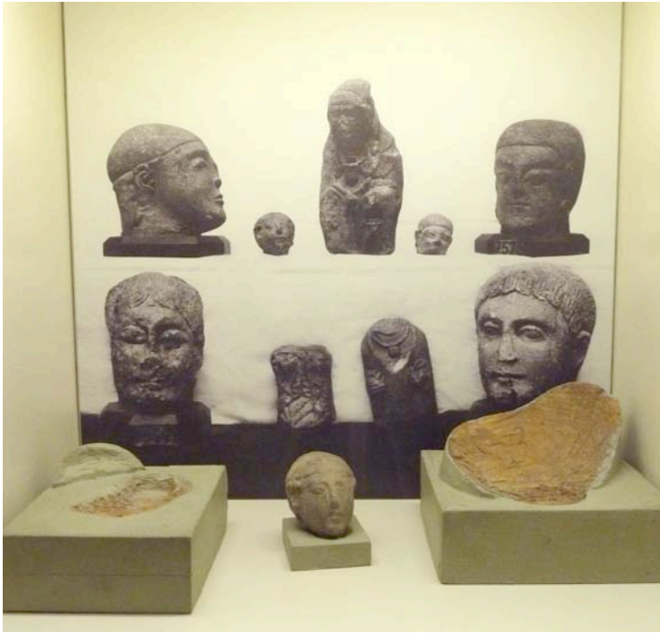
Fig. 6. Integración de piezas y recursos expositivos.

se hizo especial hincapié en explicar las transformaciones del edificio, con infografías en las que se levantaban los distintos espacios y planos en 3D en los que puntualmente se insertaban imágenes de los primeros.