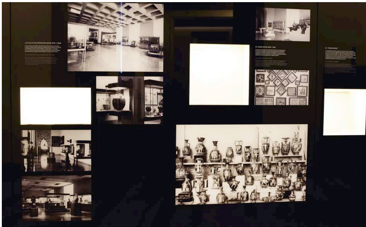
Fig. 7. Imágenes de antiguos montajes en «Tiempos para enseñar, espacios que se transforman».

al patrimonio y la Guerra Civil, además de documentales ya conocidos como Las cajas españolas 23 , Salvemos el Prado 24 , y Biblioteca en Guerra 25 . También tuvimos acceso a las fotografías que sobre este tema se guardan en el Gabinete de Dibujos y Estampas del Museo del Prado.