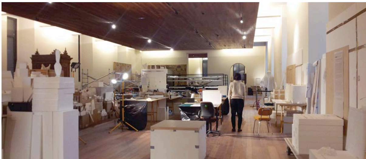
Fig. 2. Sala habilitada para los trabajos de «replanteo de vitrinas».

el hecho de que en un determinado tipo de vitrinas la luz sólo iba a provenir desde la parte frontal del techo por lo que las sombras han sido inevitables 4 .