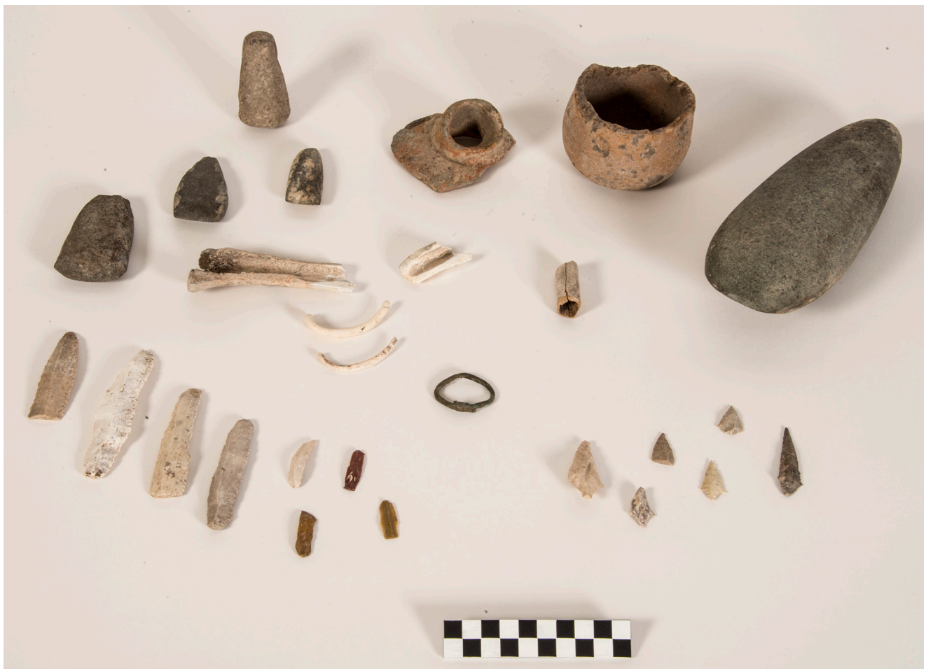
Fig. 2. Selección de materiales del Baño de la Mora–Casa de la cueva de Lucas.

Entre los restos malacológicos, la concha que dibuja Siret con clara referencia a la faceta trabajada por abrasión, es una Glycymeris glycymeris L. 1758 y tiene el interés de conservar restos de ocre, por lo que se trataría de un pocillo para este mineral. Pericot cita un «ejemplar toscano» de brazalete de concha expuesto en la Exposición Universal de Barcelona (1929: 25), pero tal vez se equivoca respecto a los conjuntos inmediatos de Garcel o Diana, ya que el catálogo de dicha exposición sólo indica materiales cerámicos y líticos para la Cueva de Lucas (Bosch, op. cit. : 60). Lo que sí corresponde al yacimiento es una Columbella rustica L. 1758 y 4 lúnulas, todas con abrasión marina (fig. 2).